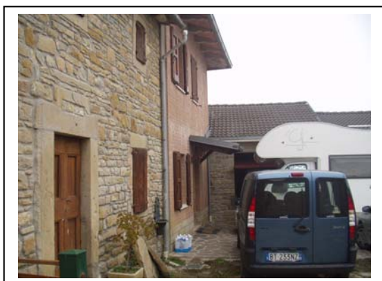
UNITA' EDILIZIE NR. 5-7