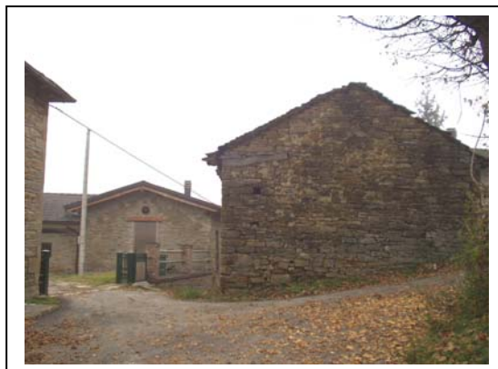
UNITA' EDILIZIE NR. 4-7