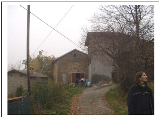
UNITA' EDILIZIE NR. 5-7-8