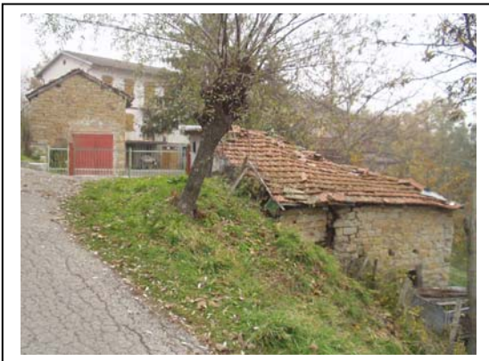
UNITA' EDILIZIA NR. 11