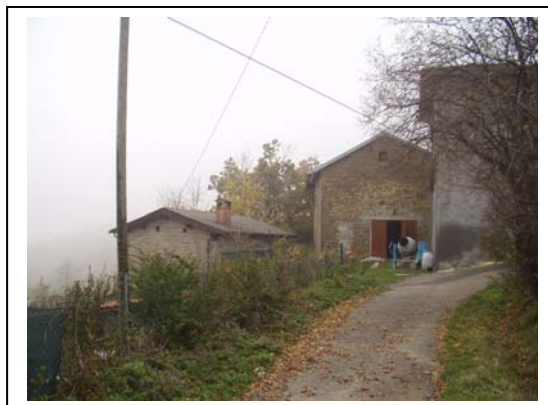
UNITA' EDILIZIE NR. 5-7-8