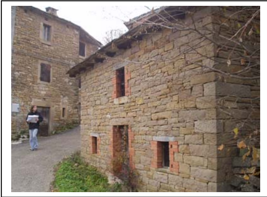
UNITA' EDILIZIA NR. 9