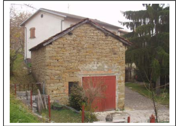
UNITA' EDILIZIA NR. 10