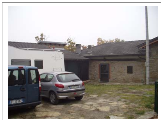
UNITA' EDILIZIA NR. 7