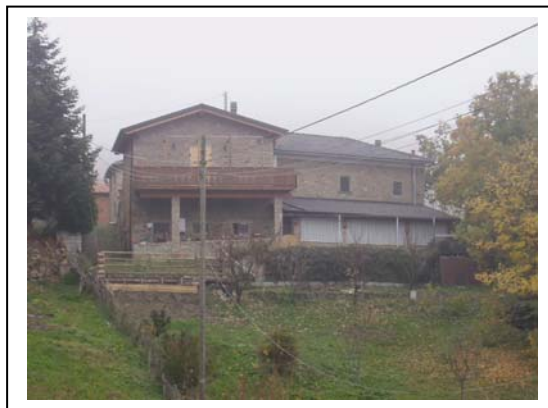
UNITA' EDILIZIA NR. 7