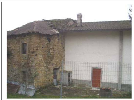
UNITA' EDILIZIA NR. 3-4