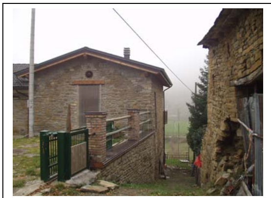
UNITA' EDILIZIA NR. 7