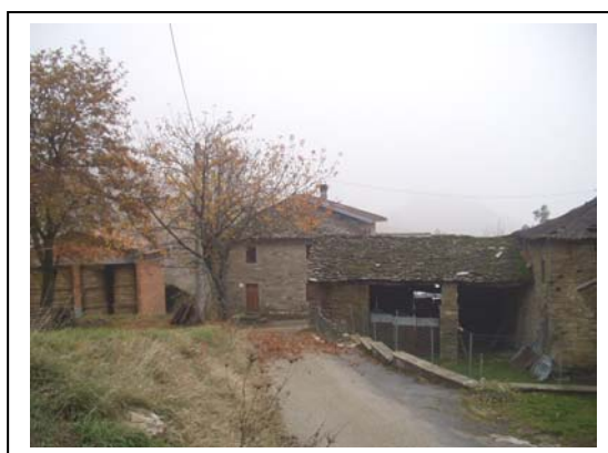
UNITA' EDILIZIE NR. 4-5-6