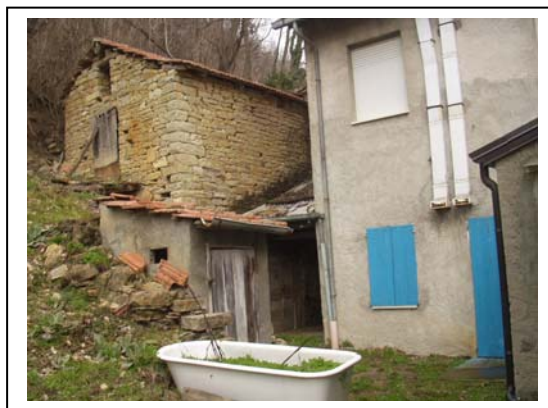
UNITA' EDILIZIE NR. 2-3