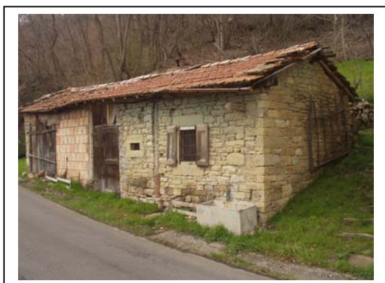
UNITA' EDILIZIA NR. 4