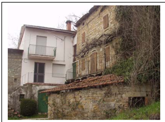
UNITA' EDILIZIE NR. 2-3