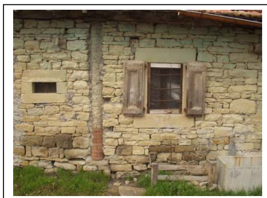
UNITA' EDILIZIA NR. 4