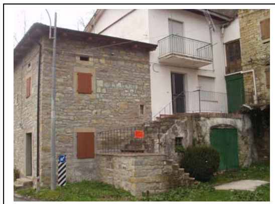
UNITA' EDILIZIE NR. 1-3