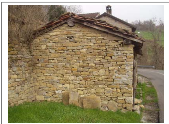
UNITA' EDILIZIA NR. 4