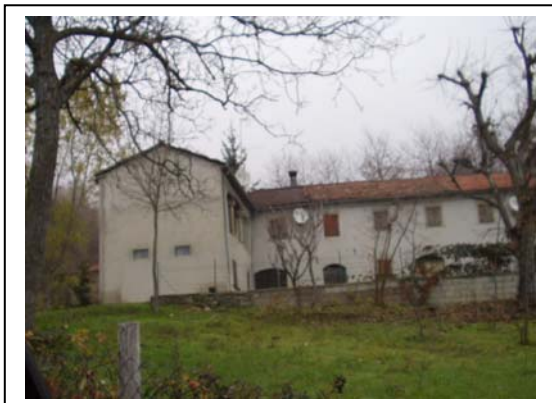
UNITA' EDILIZIA NR. 1