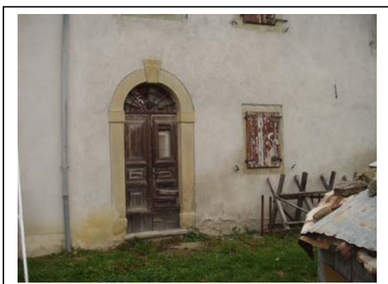
UNITA' EDILIZIA NR. 1