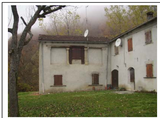
UNITA' EDILIZIA NR. 1