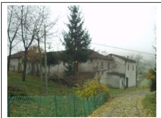
UNITA' EDILIZIA NR. 1