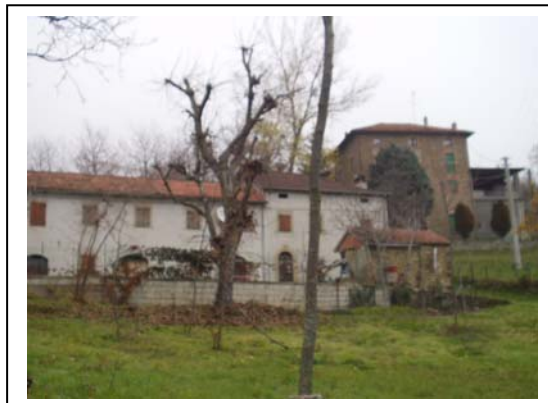
UNITA' EDILIZIE NR. 1-2-3