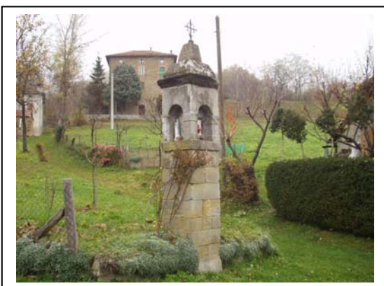
UNITA' EDILIZIA NR. 7