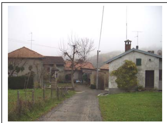
UNITA' EDILIZIE NR. 1-2-3