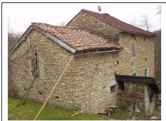
UNITA' EDILIZIE NR. 1-2