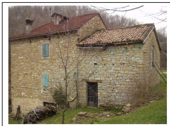
UNITA' EDILIZIE NR. 1-2