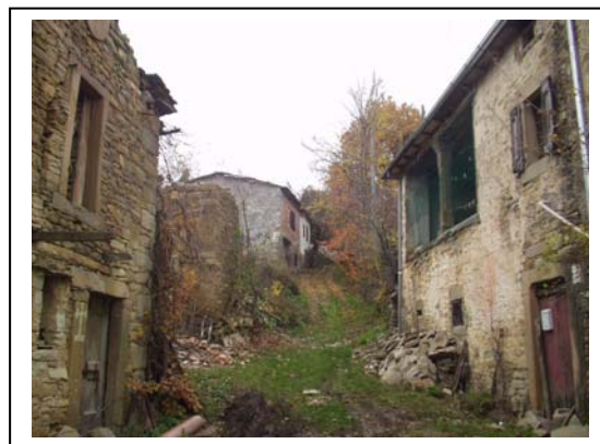
UNITA' EDILIZIE NR. 1-2-3-4