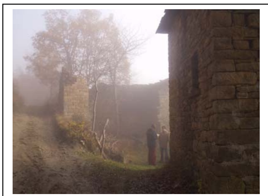
UNITA' EDILIZIE NR. 1-2