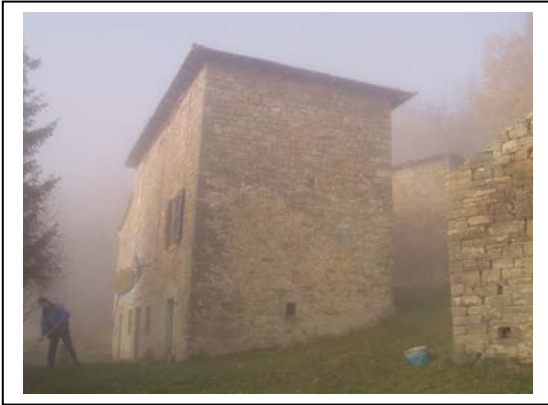
UNITA' EDILIZIA NR. 3