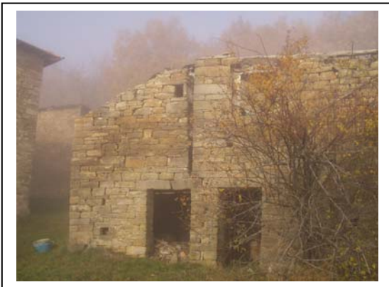
UNITA' EDILIZIA NR. 4