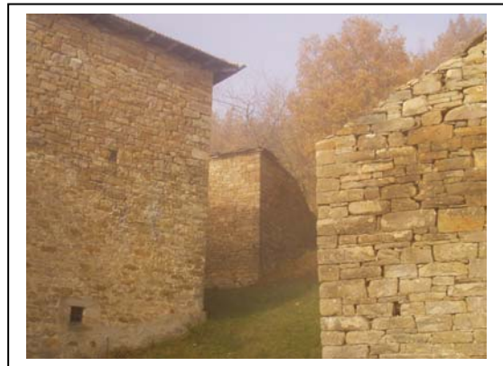
UNITA' EDILIZIE NR. 2-3-4