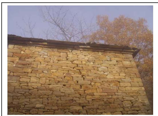
UNITA' EDILIZIA NR. 2