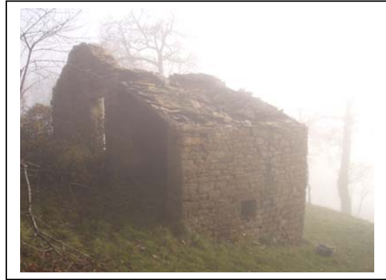
UNITA' EDILIZIA NR. 4