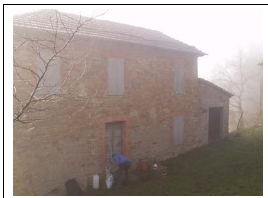
UNITA' EDILIZIA NR. 3