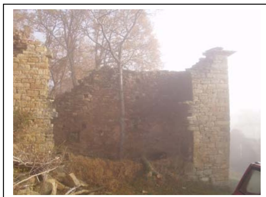
UNITA' EDILIZIA NR. 2