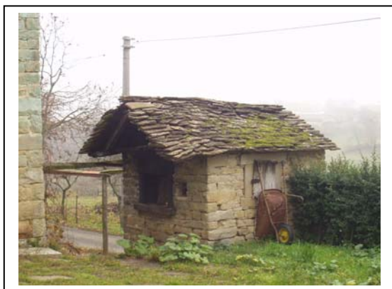
UNITA' EDILIZIA NR. 8