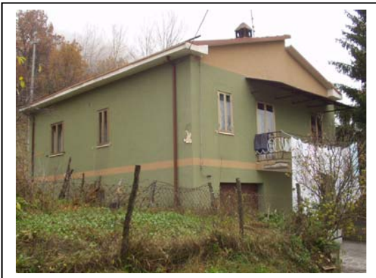
UNITA' EDILIZIA NR. 10