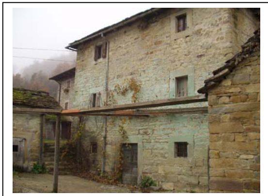
UNITA' EDILIZIA NR. 6