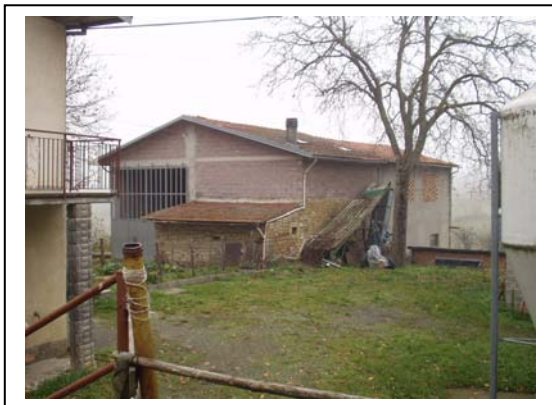
UNITA' EDILIZIA NR. 4