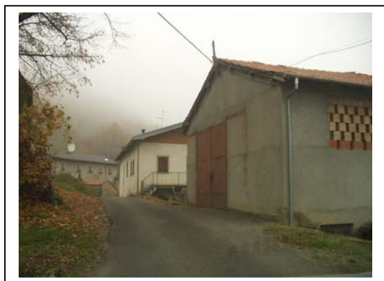
UNITA' EDILIZIE NR. 1-2