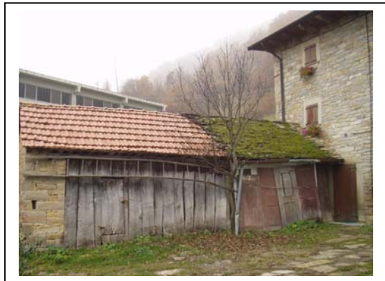
UNITA' EDILIZIA NR. 7