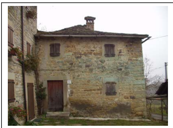
UNITA' EDILIZIA NR. 6