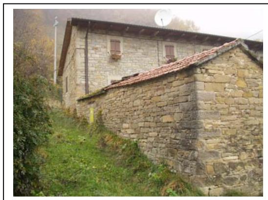
UNITA' EDILIZIE NR. 5-7