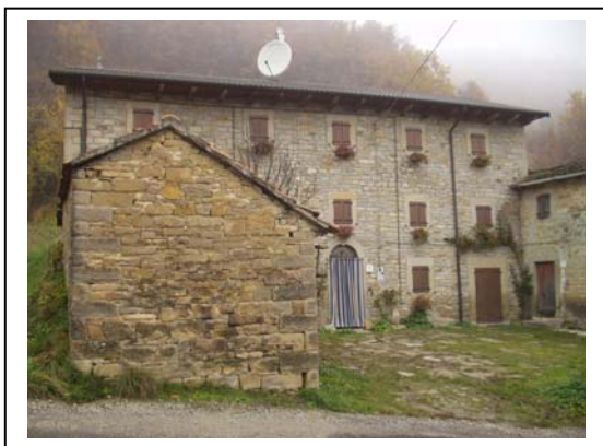
UNITA' EDILIZIA NR. 5-7