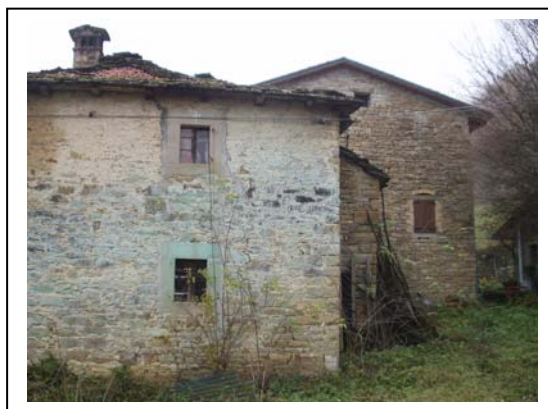
UNITA' EDILIZIA NR. 6