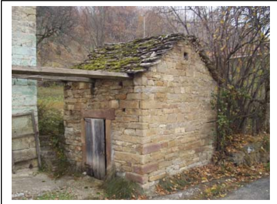
UNITA' EDILIZIA NR. 9