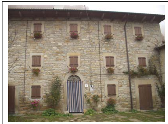
UNITA' EDILIZIA NR. 5