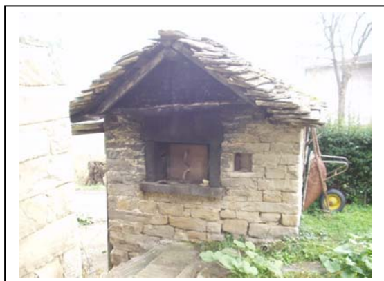
UNITA' EDILIZIA NR. 8