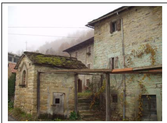
UNITA' EDILIZIE NR. 7-8