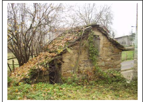
UNITA' EDILIZIA NR. 9