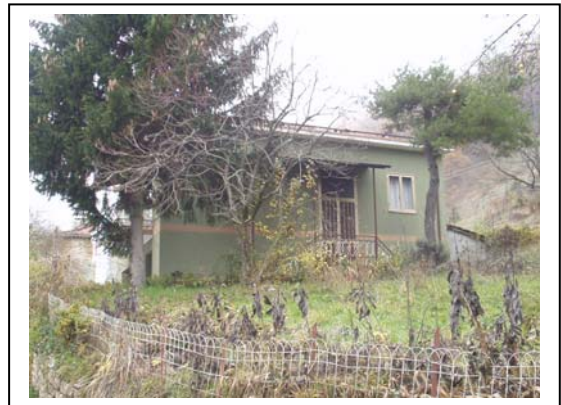
UNITA' EDILIZIA NR. 10