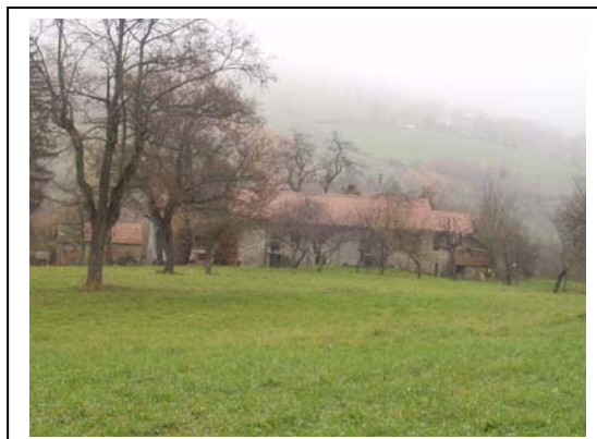
UNITA' EDILIZIE NR. 1-2-3-4