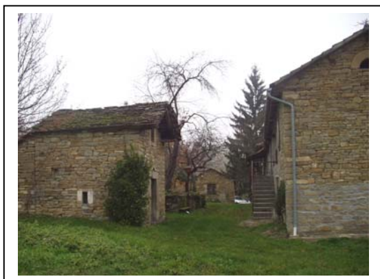
UNITA' EDILIZIE NR. 1-2