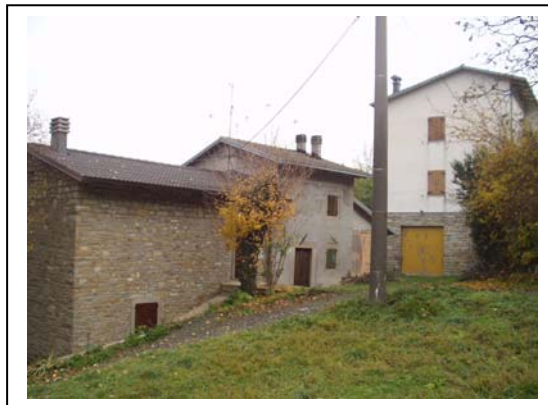
UNITA' EDILIZIE NR. 1-2