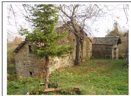
UNITA' EDILIZIE NR. 5-6