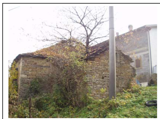
UNITA' EDILIZIE NR. 6-3