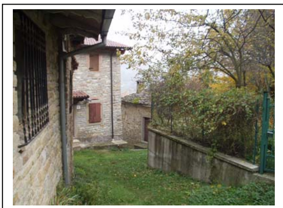
UNITA' EDILIZIE NR. 2-3