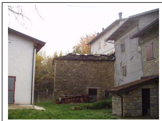
UNITA' EDILIZIE NR. 2-3