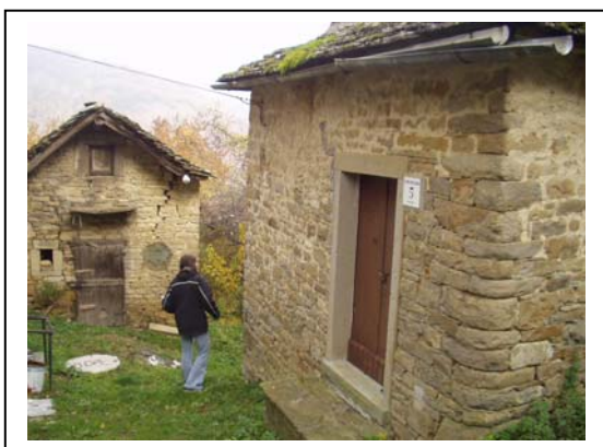
UNITA' EDILIZIE NR. 4-5