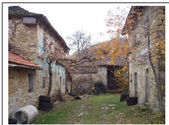
UNITA' EDILIZIE NR. 1-2-3