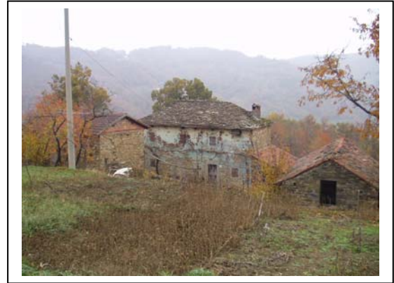
UNITA' EDILIZIE NR. 1-2-3