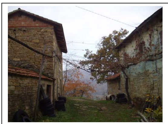
UNITA' EDILIZIE NR. 1-2