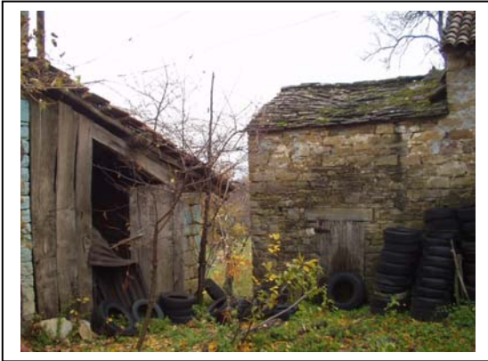
UNITA' EDILIZIA NR. 1-2