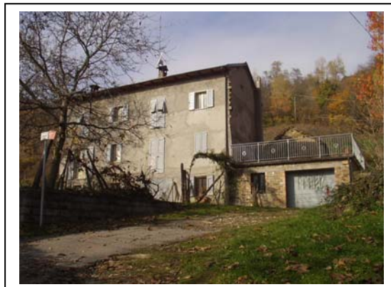
UNITA' EDILIZIE NR. 2-3