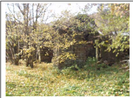
UNITA' EDILIZIA NR. 8