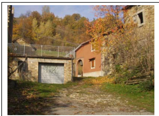
UNITA' EDILIZIE NR. 2-3-4-5