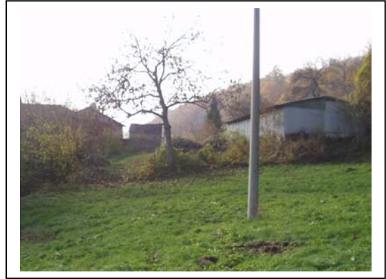
UNITA' EDILIZIA NR. 3-7