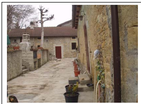
UNITA' EDILIZIA NR. 8-7