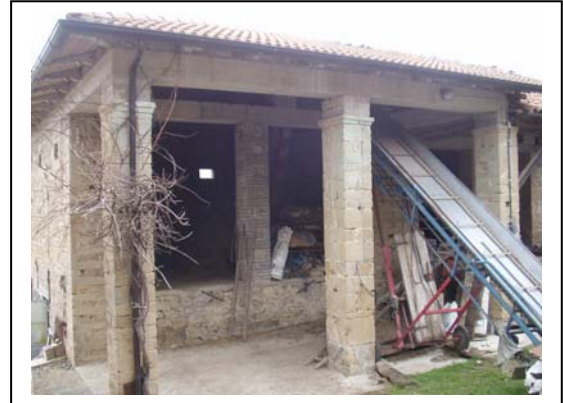
UNITA' EDILIZIA NR. 10