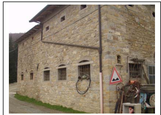
UNITA' EDILIZIA NR. 10