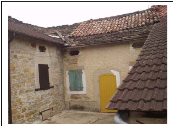
UNITA' EDILIZIA NR. 8-7