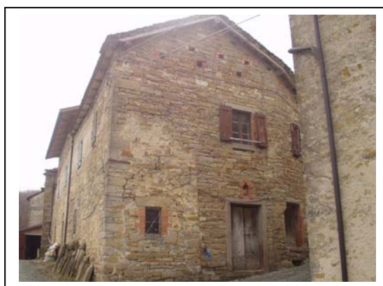
UNITA' EDILIZIA NR. 9