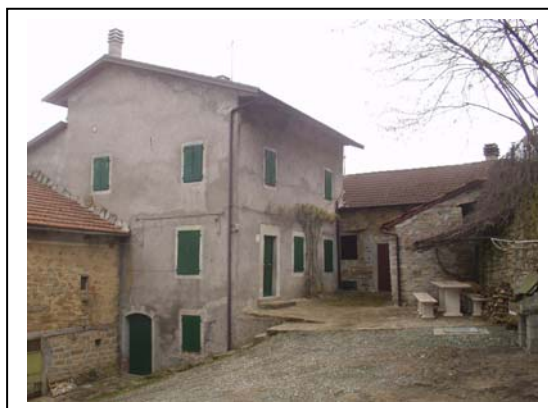
UNITA' EDILIZIA NR. 9