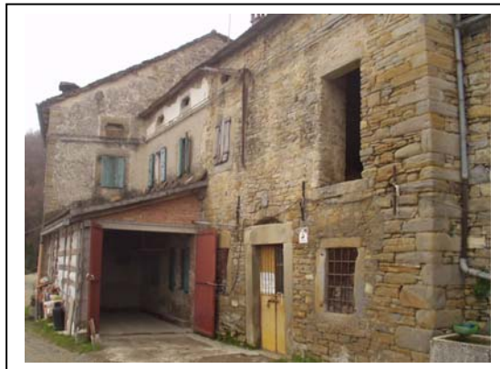
UNITA' EDILIZIA NR. 6-8