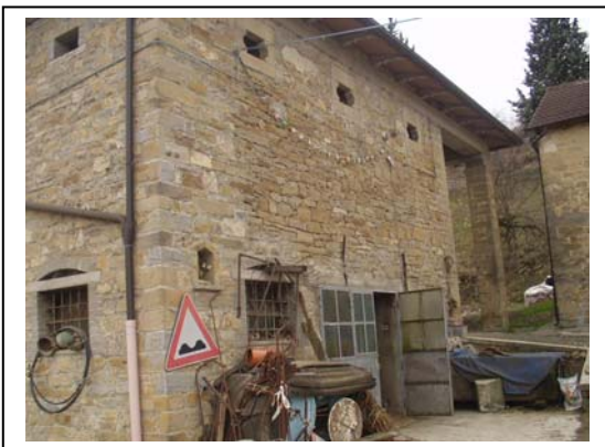
UNITA' EDILIZIA NR. 10