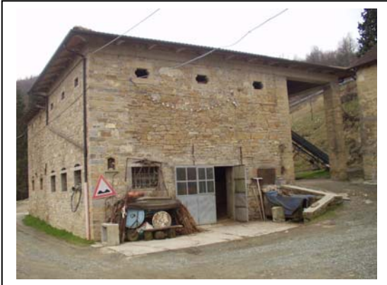
UNITA' EDILIZIA NR. 10