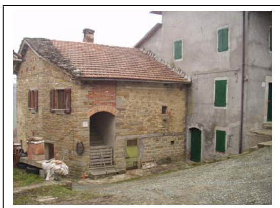
UNITA' EDILIZIA NR. 9