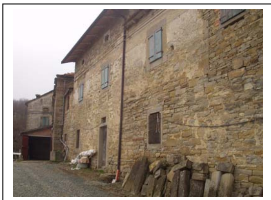
UNITA' EDILIZIA NR. 8-9