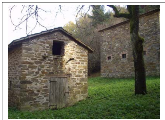
UNITA' EDILIZIA NR. 3