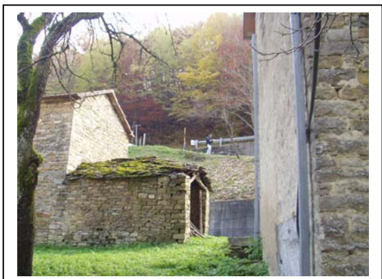
UNITA' EDILIZIA NR. 2