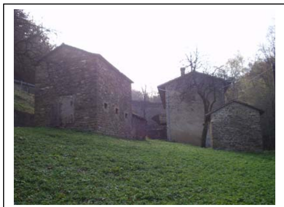
UNITA' EDILIZIE NR. 2-1-3