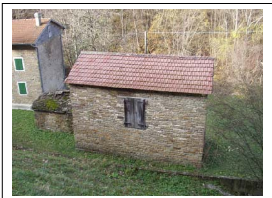
UNITA' EDILIZIA NR. 2