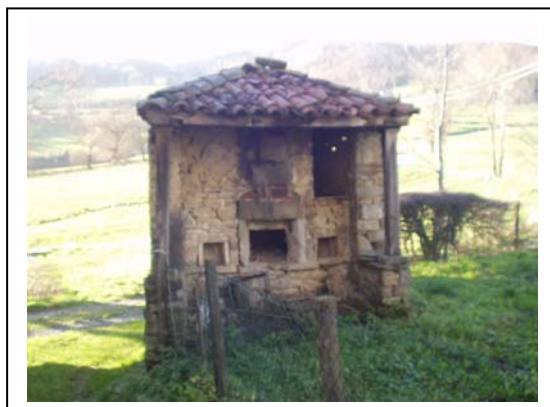
UNITA' EDILIZIA NR. 8