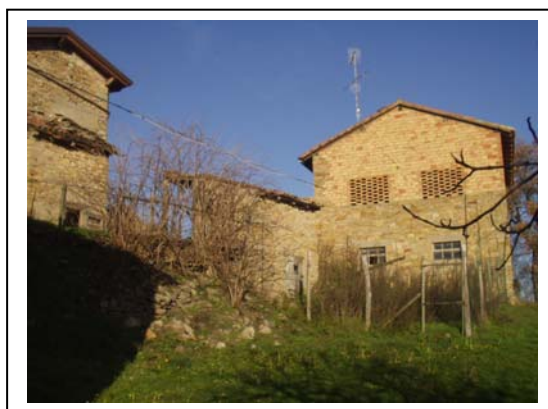
UNITA' EDILIZIE NR. 3-4-5