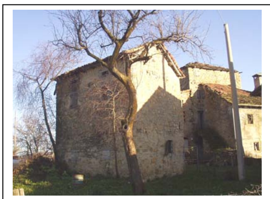
UNITA' EDILIZIE NR. 6-3