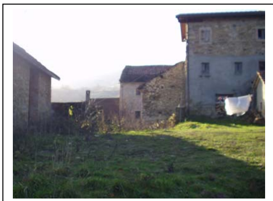
UNITA' EDILIZIA NR. 3-4