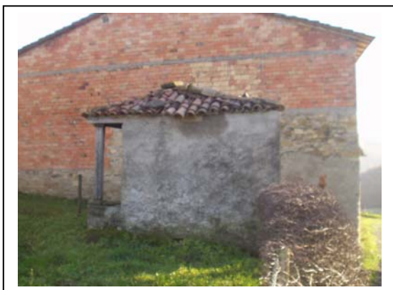
UNITA' EDILIZIE NR. 8-7