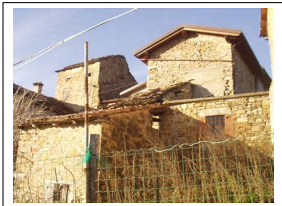
UNITA' EDILIZIE NR. 3-5