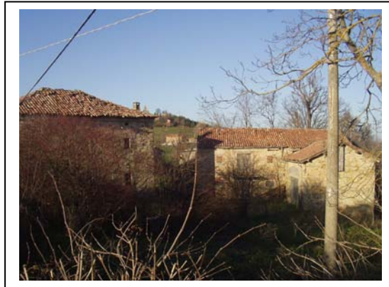
UNITA' EDILIZIE NR. 1-2