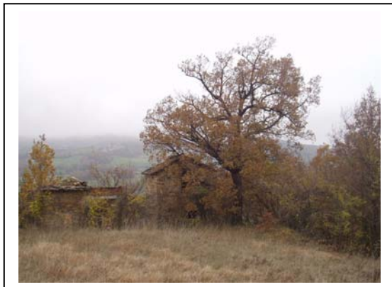
UNITA' EDILIZIE NR. 1-2