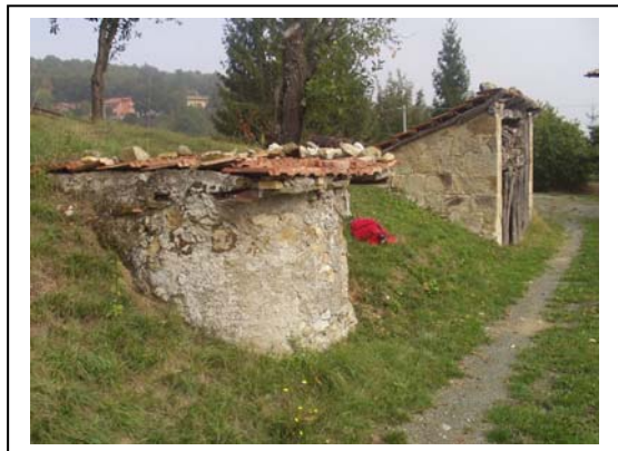
UNITA' EDILIZIE NR. 1-2