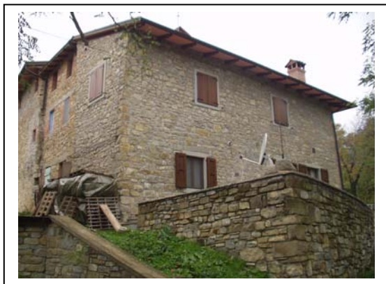
UNITA' EDILIZIA NR. 5-6