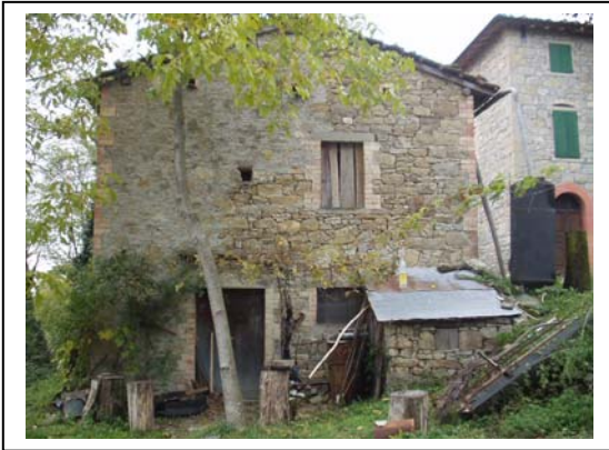
UNITA' EDILIZIA NR. 8