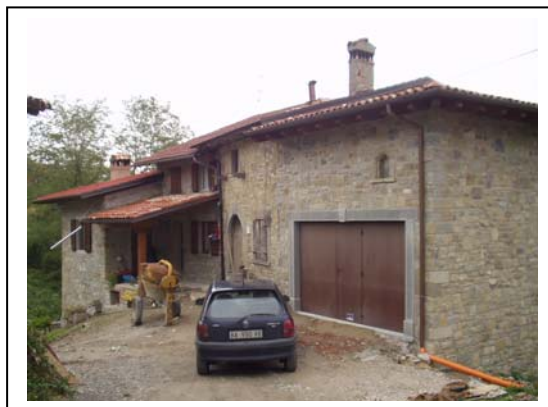
UNITA' EDILIZIA NR. 5-6