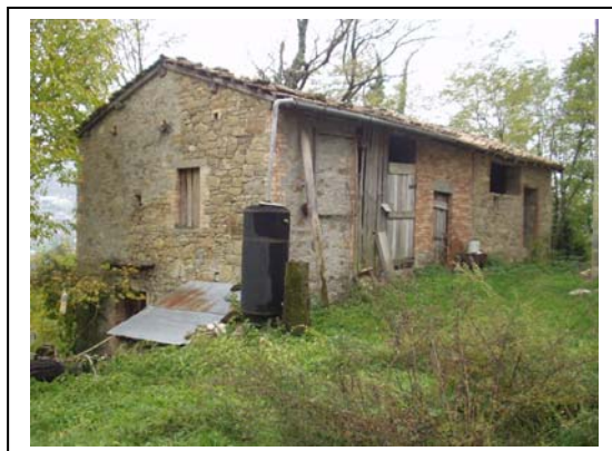
UNITA' EDILIZIA NR. 8