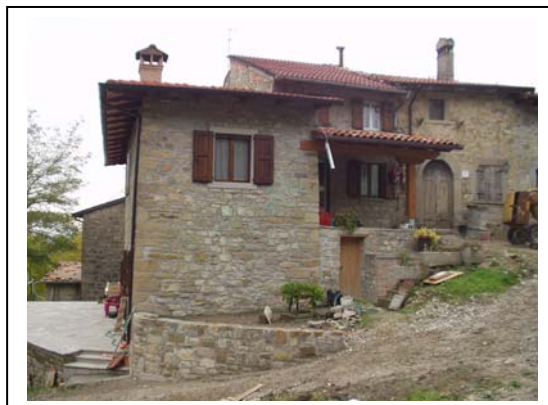
UNITA' EDILIZIA NR. 5-6