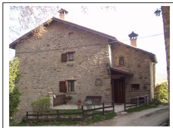
UNITA' EDILIZIA NR. 8