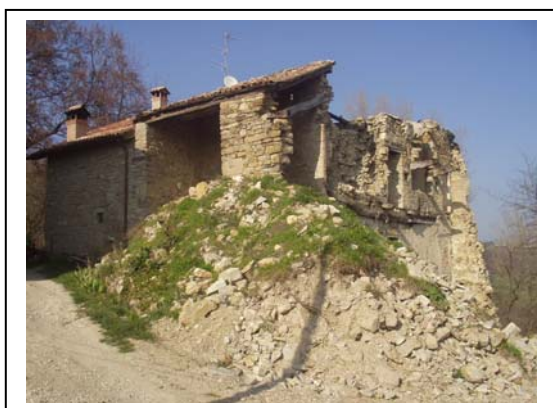
UNITA' EDILIZIA NR. 8-9