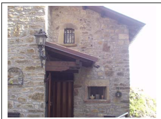
UNITA' EDILIZIA NR. 8