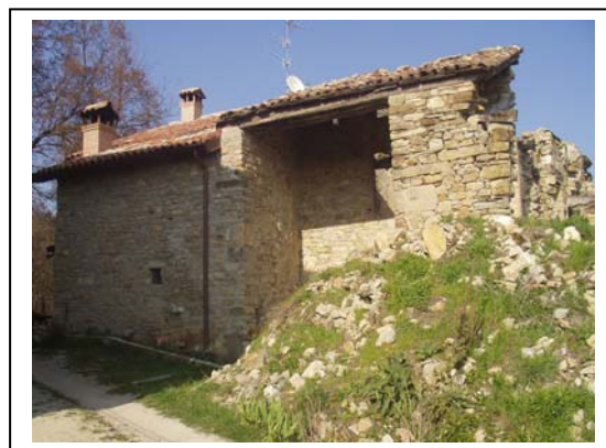
UNITA' EDILIZIA NR. 8-9