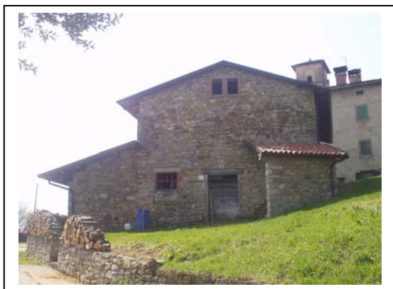
UNITA' EDILIZIA NR. 1-3