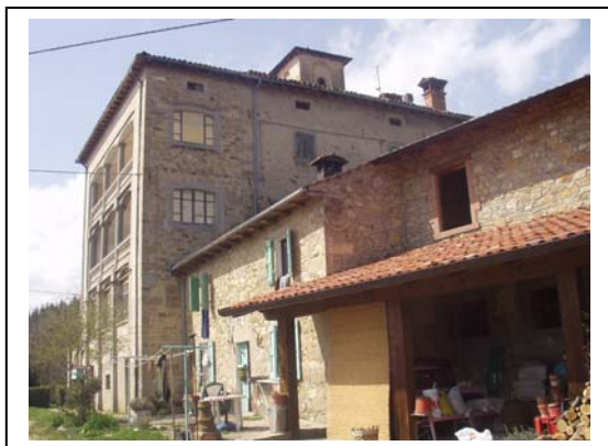
UNITA' EDILIZIA NR. 1-3