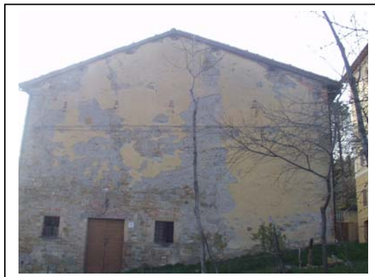
UNITA' EDILIZIA NR. 2