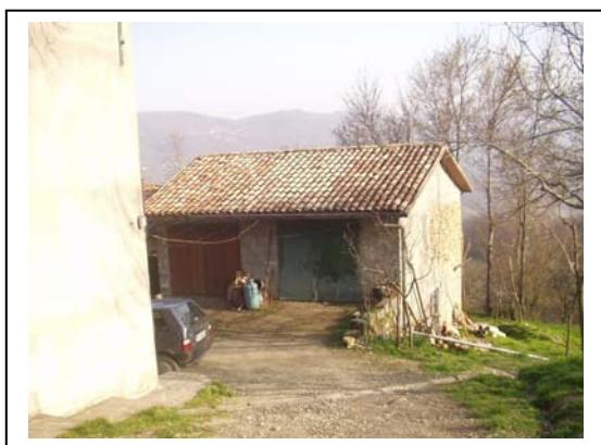
UNITA' EDILIZIA NR. 5