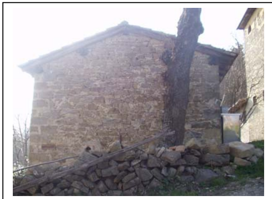
UNITA' EDILIZIA NR. 3