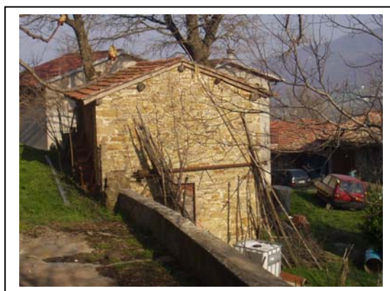
UNITA' EDILIZIA NR. 3