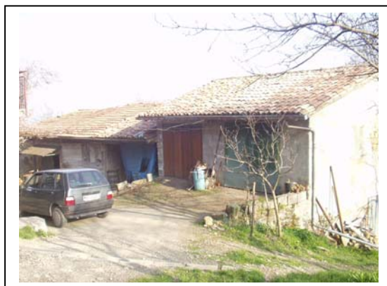
UNITA' EDILIZIA NR. 5