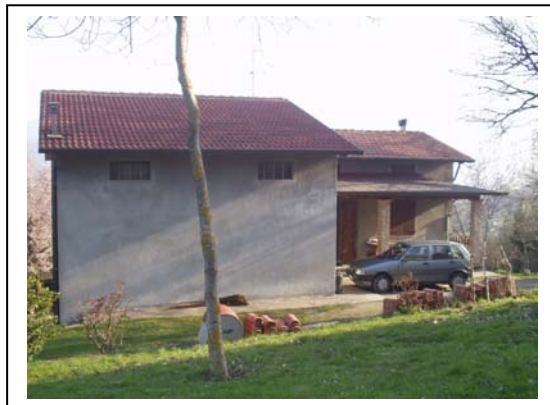
UNITA' EDILIZIA NR. 4