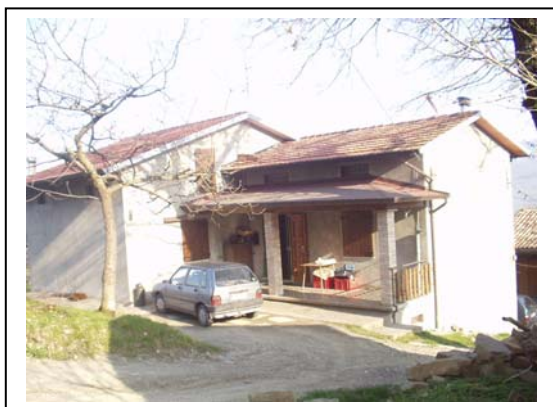
UNITA' EDILIZIA NR. 4