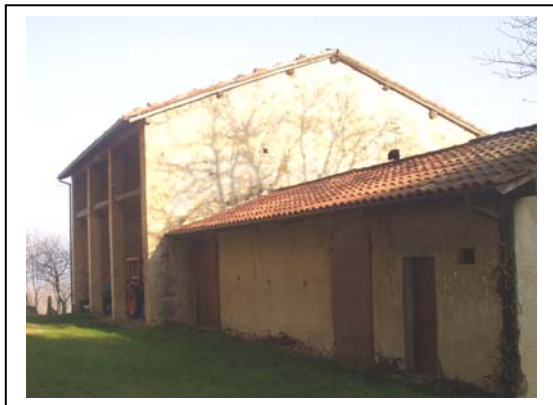
UNITA' EDILIZIA NR. 2