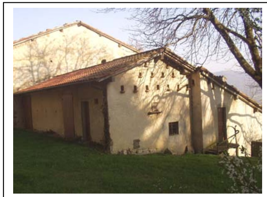
UNITA' EDILIZIA NR. 2