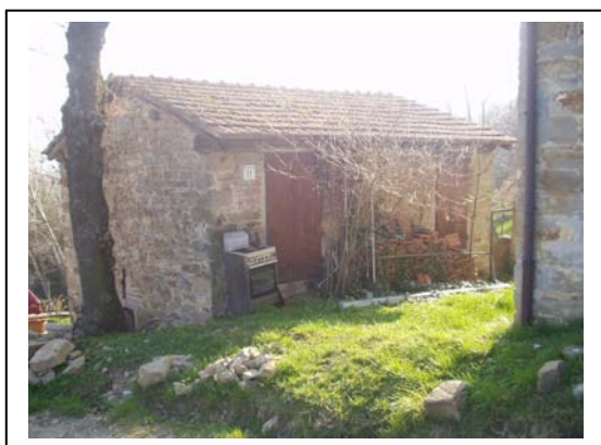
UNITA' EDILIZIA NR. 3