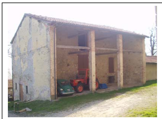
UNITA' EDILIZIA NR. 2