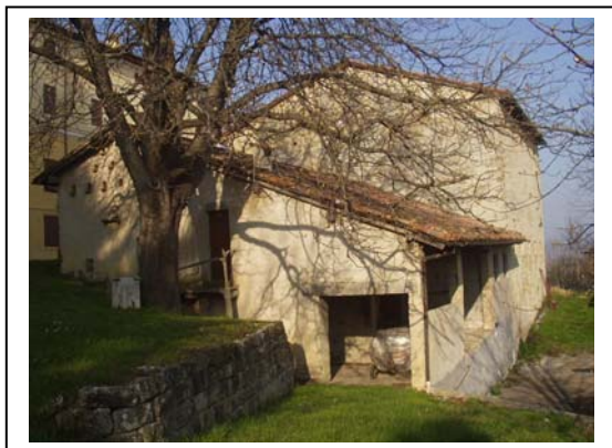
UNITA' EDILIZIA NR. 2