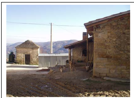
UNITA' EDILIZIE NR. 2-3