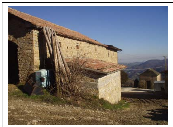
UNITA' EDILIZIA NR. 1