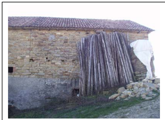
UNITA' EDILIZIA NR. 1