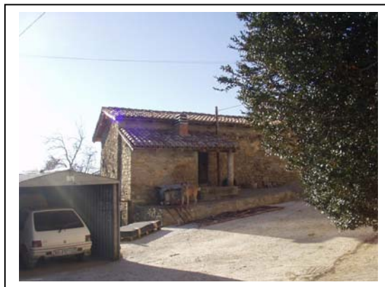
UNITA' EDILIZIA NR. 2