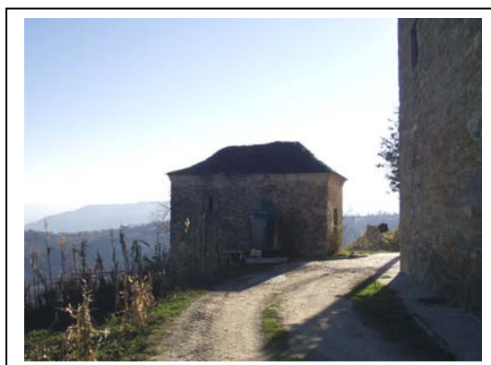
UNITA' EDILIZIA NR. 3