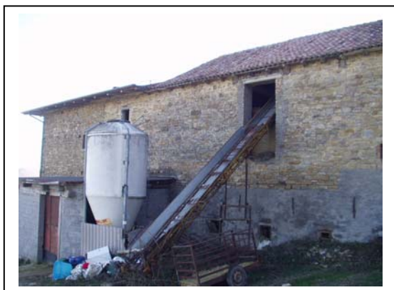
UNITA' EDILIZIA NR. 1