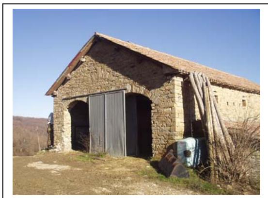
UNITA' EDILIZIA NR. 1