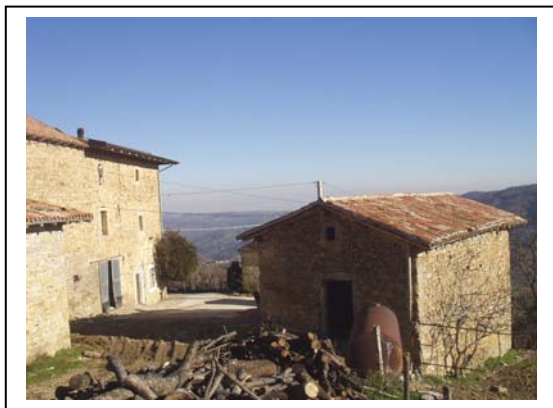
UNITA' EDILIZIE NR. 1-2