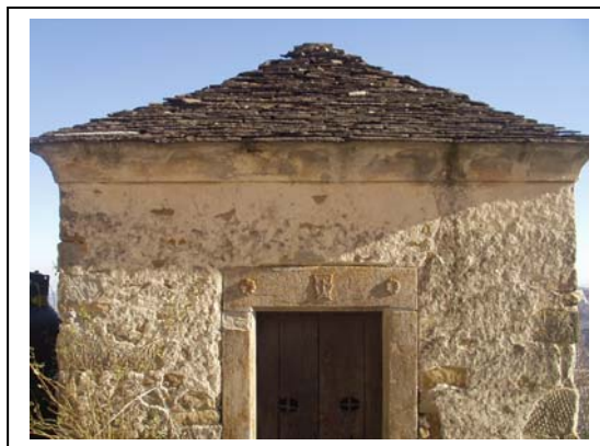
UNITA' EDILIZIA NR. 3