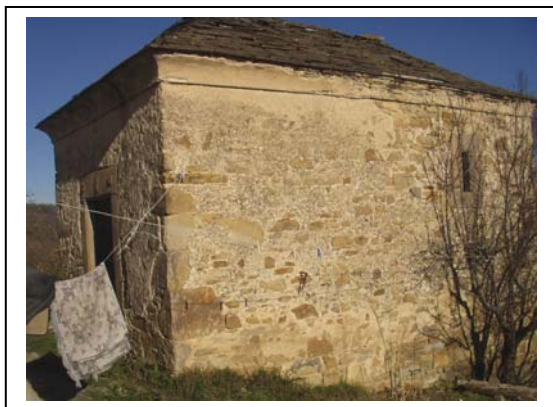
UNITA' EDILIZIA NR. 3