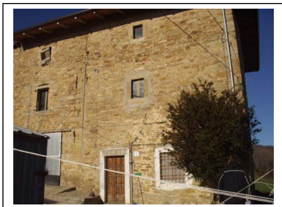
UNITA' EDILIZIA NR. 1