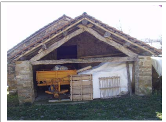
UNITA' EDILIZIA NR. 5