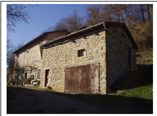
UNITA' EDILIZIA NR. 10