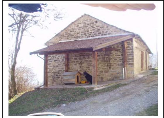
UNITA' EDILIZIA NR. 9