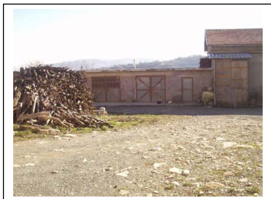
UNITA' EDILIZIA NR. 7