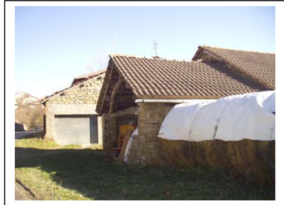
UNITA' EDILIZIE NR. 4-5