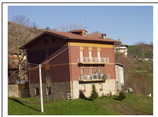
UNITA' EDILIZIA NR. 8