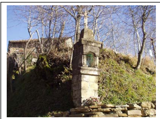
UNITA' EDILIZIA NR. 12