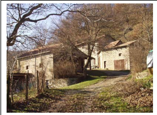
UNITA' EDILIZIE NR. 9-10