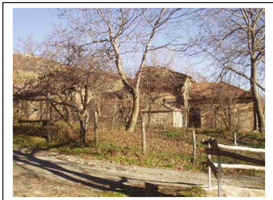
UNITA' EDILIZIA NR. 6