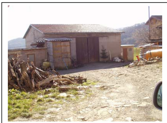
UNITA' EDILIZIA NR. 7