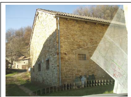
UNITA' EDILIZIA NR. 5