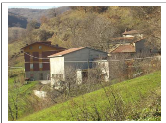
UNITA' EDILIZIE NR. 6-7-8