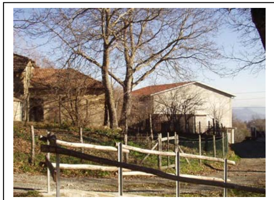
UNITA' EDILIZIE NR. 6-7