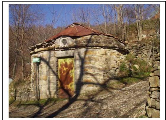
UNITA' EDILIZIA NR. 11