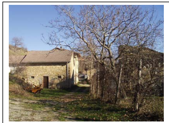
UNITA' EDILIZIA NR. 5