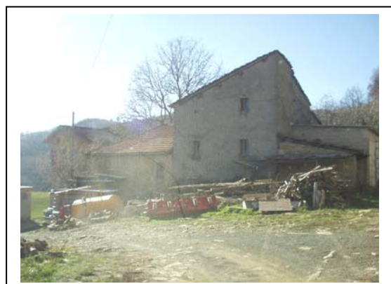
UNITA' EDILIZIA NR. 6