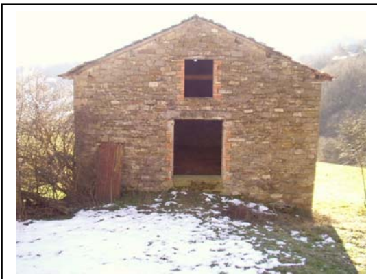
UNITA' EDILIZIA NR. 4