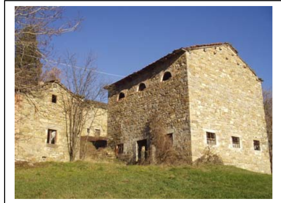
UNITA' EDILIZIE NR. 3-4