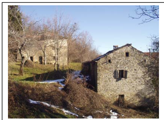
UNITA' EDILIZIE NR. 1-2