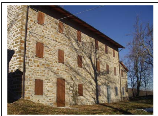
UNITA' EDILIZIA NR. 2