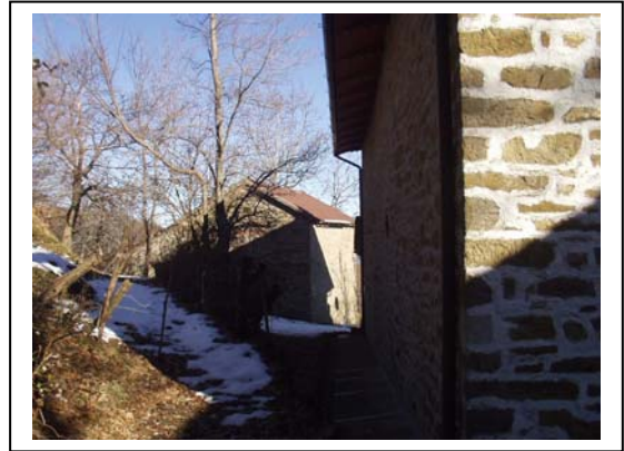
UNITA' EDILIZIE NR. 2-3