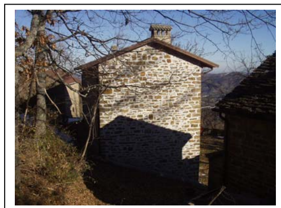
UNITA' EDILIZIA NR. 2