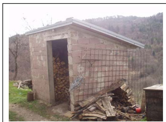
UNITA' EDILIZIA NR. 6