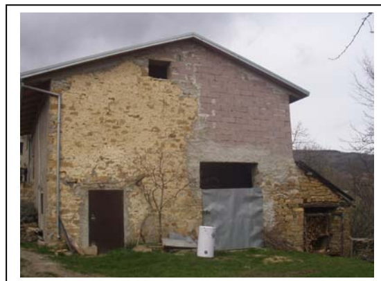
UNITA' EDILIZIA NR. 4