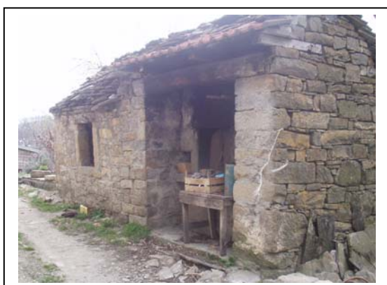
UNITA' EDILIZIA NR. 5