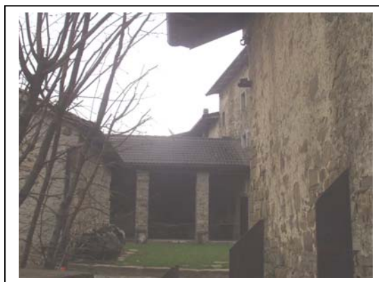
UNITA' EDILIZIA NR. 4