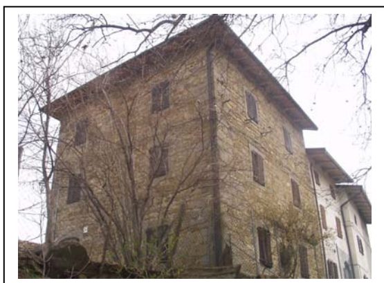
UNITA' EDILIZIA NR. 4