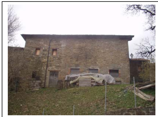
UNITA' EDILIZIA NR. 4