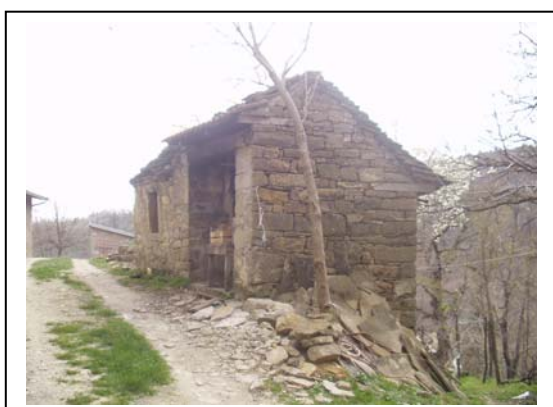
UNITA' EDILIZIA NR. 5