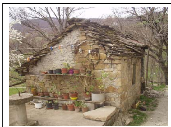
UNITA' EDILIZIA NR. 5