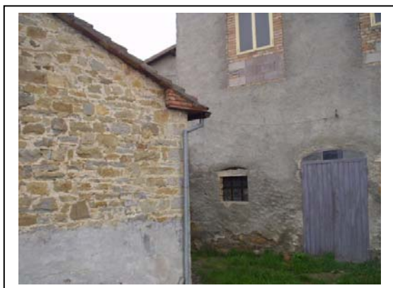
UNITA' EDILIZIA NR. 2-3