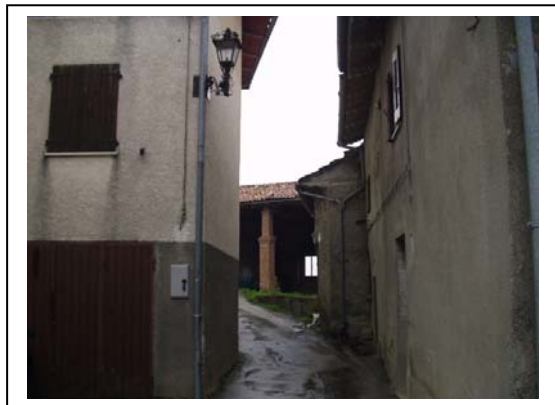
UNITA' EDILIZIE NR. 1-5