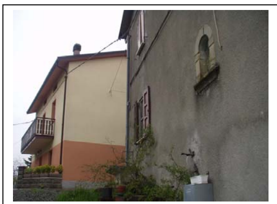
UNITA' EDILIZIE NR. 1-4