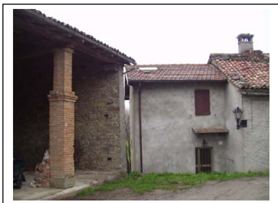
UNITA' EDILIZIE NR. 1-2