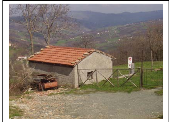
UNITA' EDILIZIA NR. 6