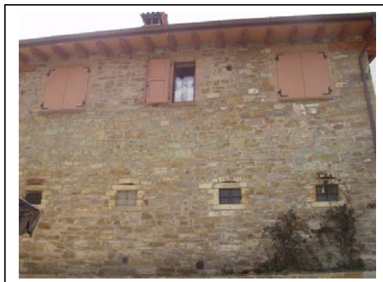
UNITA' EDILIZIA NR. 2