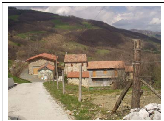
UNITA' EDILIZIE NR. 1-2-3-4