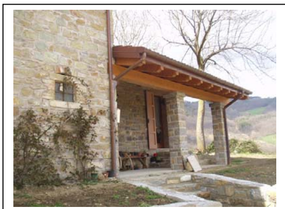
UNITA' EDILIZIA NR. 2