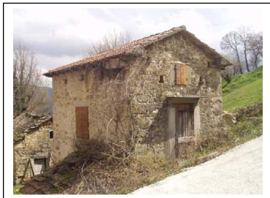
UNITA' EDILIZIA NR. 3