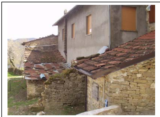
UNITA' EDILIZIA NR. 4