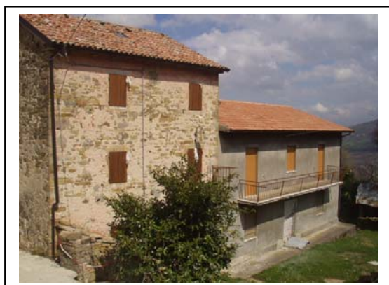
UNITA' EDILIZIA NR. 4