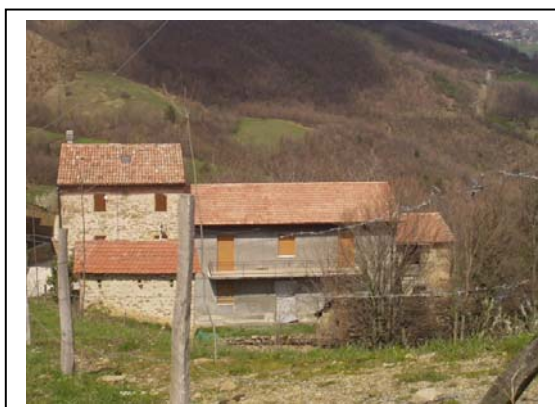
UNITA' EDILIZIE NR. 3-4