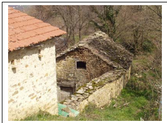
UNITA' EDILIZIA NR. 5