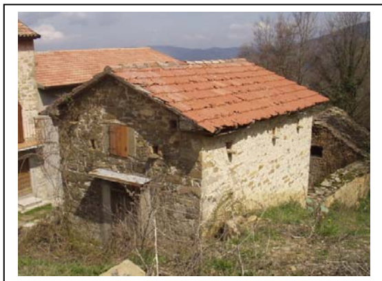
UNITA' EDILIZIA NR. 3