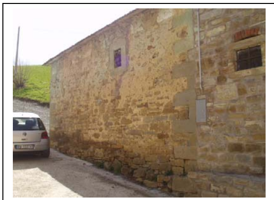
UNITA' EDILIZIA NR. 1-2