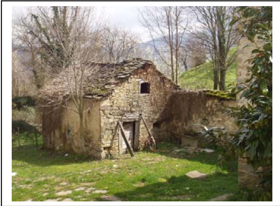
UNITA' EDILIZIA NR. 5