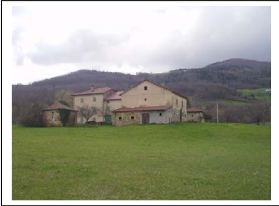
UNITA' EDILIZIE NR. 1-2-3-4