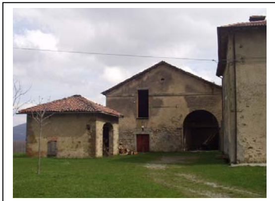
UNITA' EDILIZIE NR. 2-3