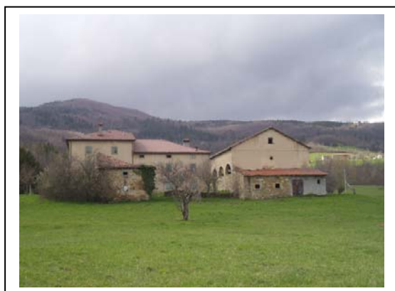
UNITA' EDILIZIE NR. 1-2-4