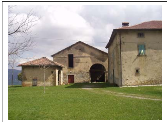
UNITA' EDILIZIE NR. 1-2-3