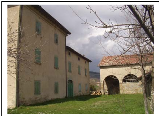
UNITA' EDILIZIE NR. 1-2