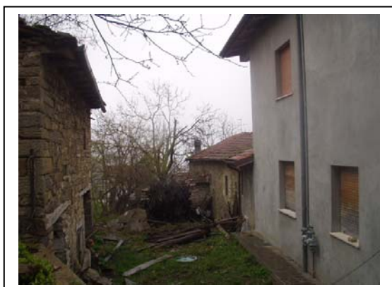
UNITA' EDILIZIE NR. 8-1