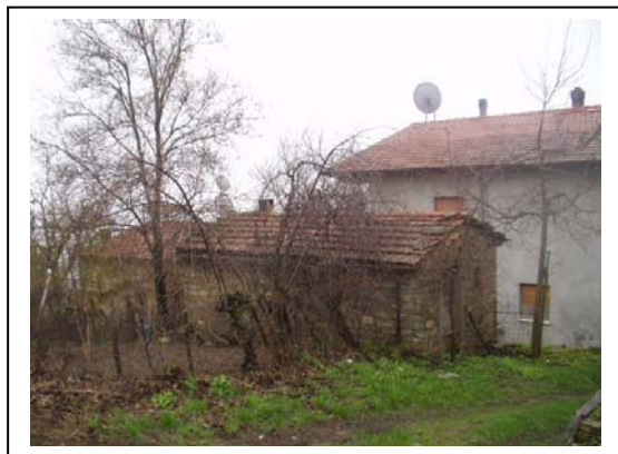
UNITA' EDILIZIA NR. 8