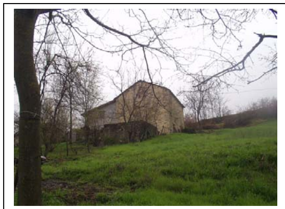
UNITA' EDILIZIA NR. 10