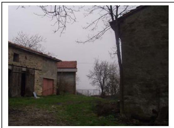
UNITA' EDILIZIE NR. 9-10