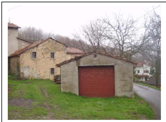
UNITA' EDILIZIE NR. 1-3