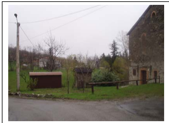
UNITA' EDILIZIE NR. 3-4