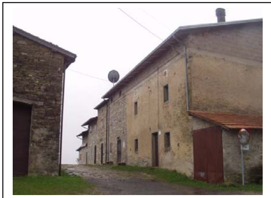
UNITA' EDILIZIA NR. 6