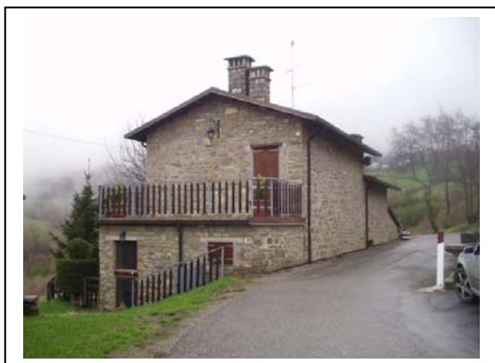
UNITA' EDILIZIA NR. 8