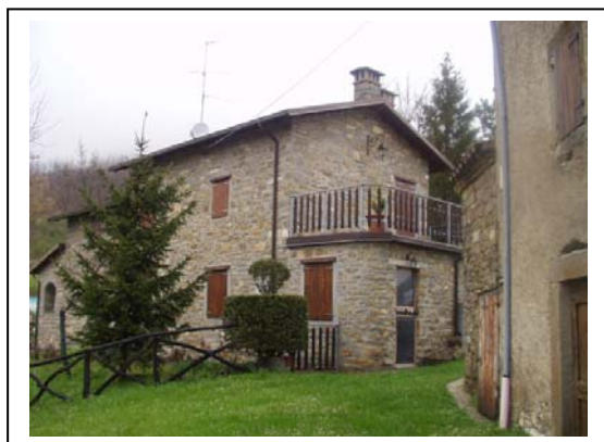
UNITA' EDILIZIA NR. 8