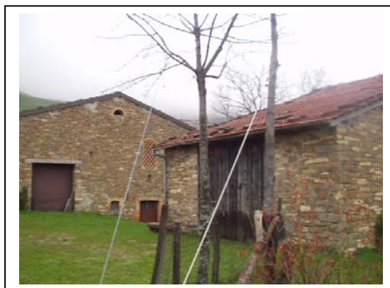
UNITA' EDILIZIE NR. 1-2