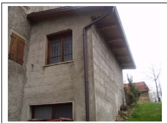
UNITA' EDILIZIA NR. 6