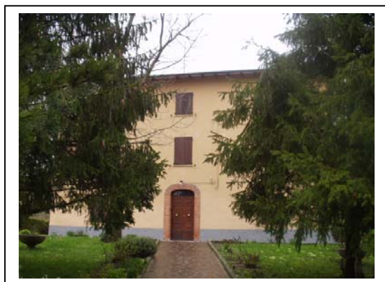
UNITA' EDILIZIA NR. 5