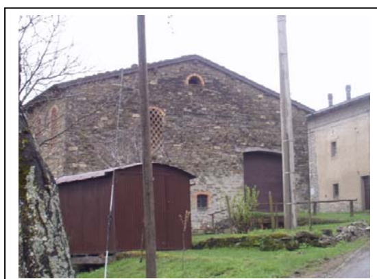
UNITA' EDILIZIE NR. 1-3