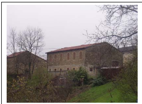
UNITA' EDILIZIE NR. 1-2