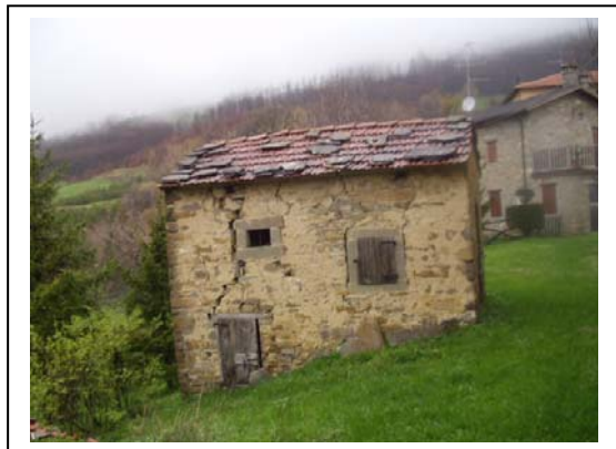
UNITA' EDILIZIA NR. 7