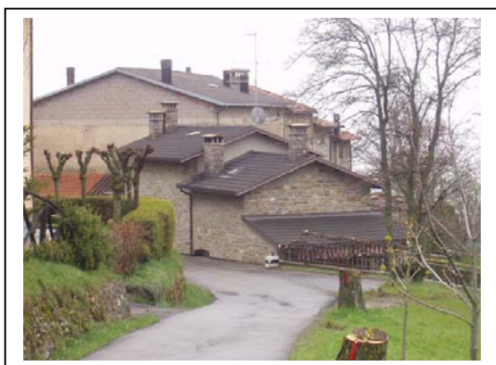
UNITA' EDILIZIA NR. 8