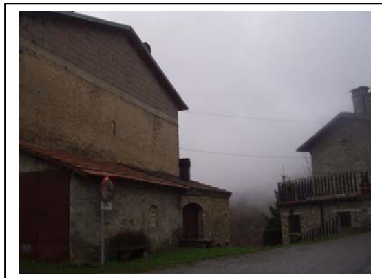
UNITA' EDILIZIA NR. 6