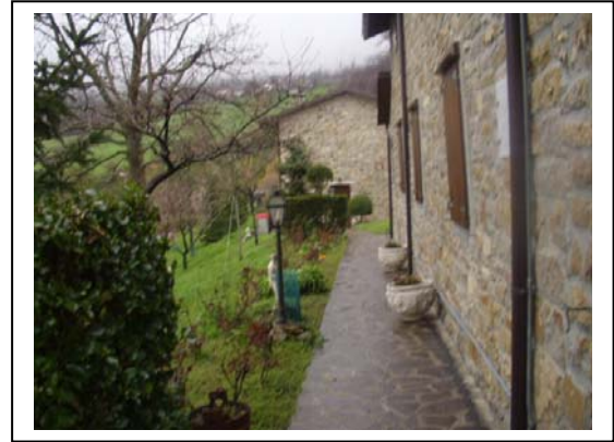
UNITA' EDILIZIE NR. 8-9