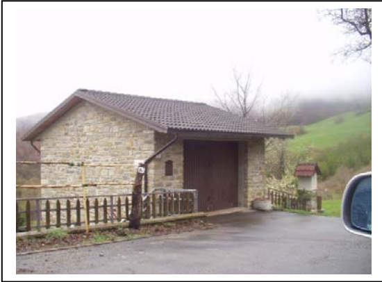
UNITA' EDILIZIA NR. 9