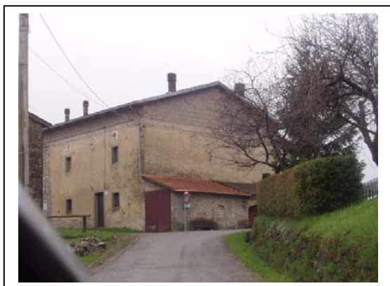
UNITA' EDILIZIA NR. 6