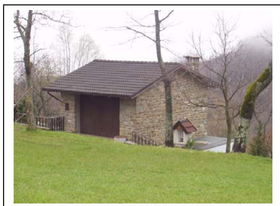
UNITA' EDILIZIA NR. 9