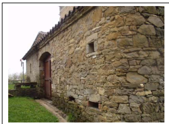
UNITA' EDILIZIA NR. 6