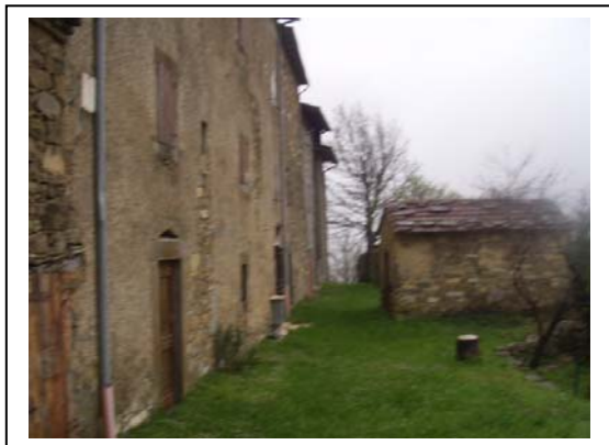
UNITA' EDILIZIE NR. 6-7