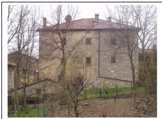
UNITA' EDILIZIE NR. 2-3