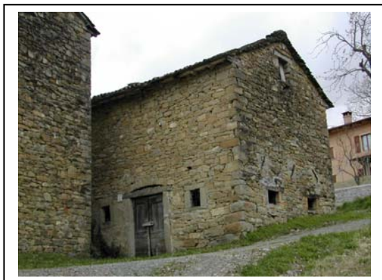
UNITA' EDILIZIA NR. 6