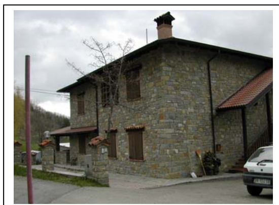
UNITA' EDILIZIA NR. 3