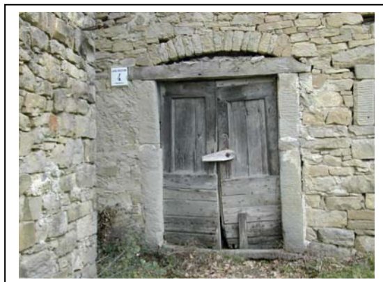
UNITA' EDILIZIA NR. 6