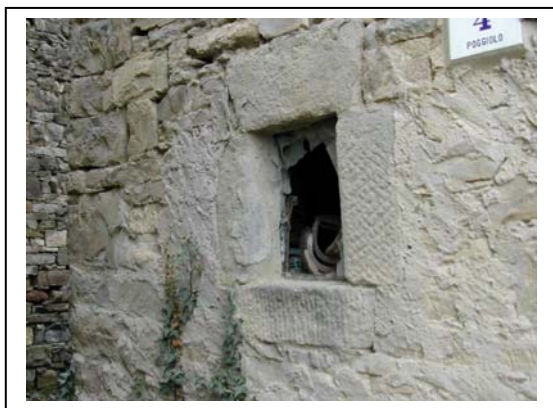
UNITA' EDILIZIA NR. 6