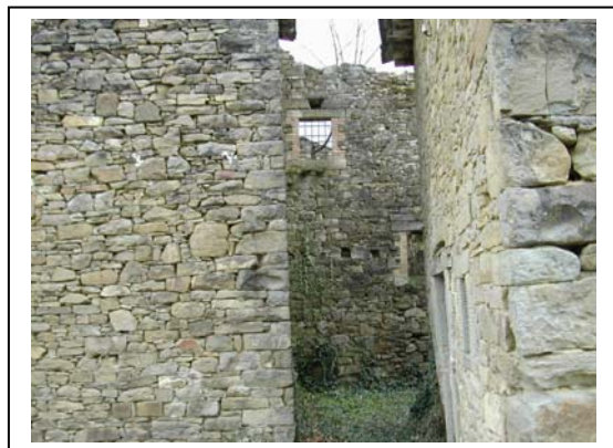
UNITA' EDILIZIA NR. 9