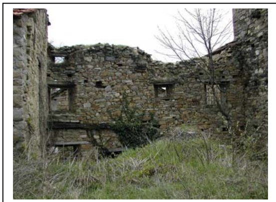
UNITA' EDILIZIA NR. 9