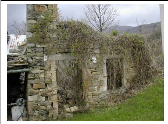
UNITA' EDILIZIA NR. 14