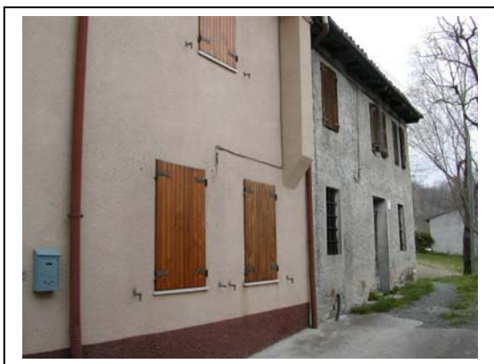
UNITA' EDILIZIA NR. 8