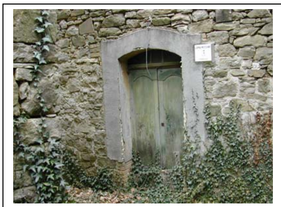
UNITA' EDILIZIA NR. 9