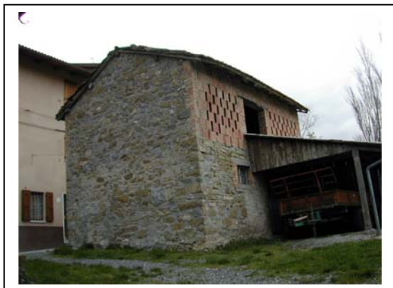
UNITA' EDILIZIA NR. 11