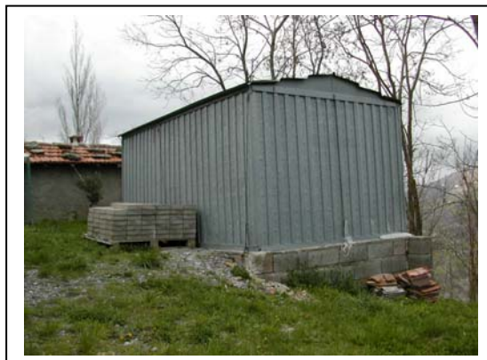
UNITA' EDILIZIA NR. 12