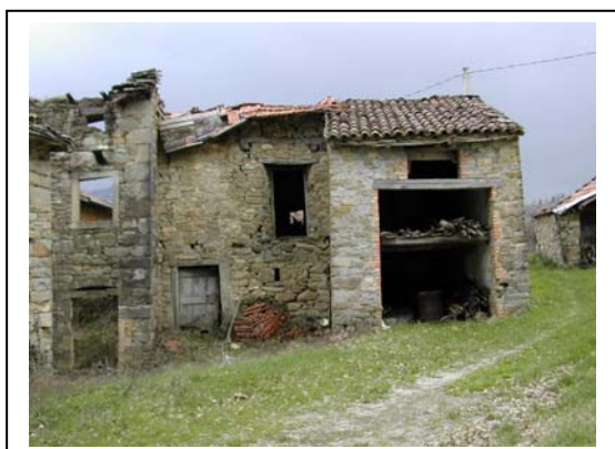
UNITA' EDILIZIA NR. 10