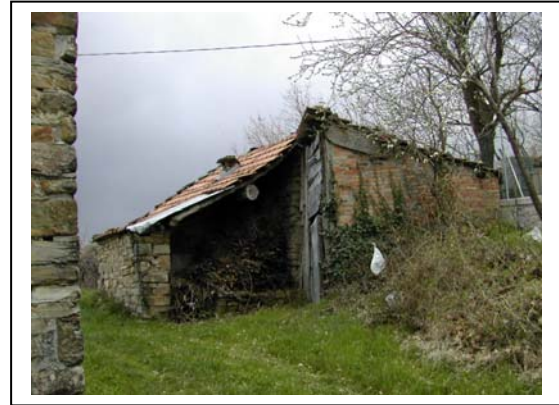
UNITA' EDILIZIA NR. 15