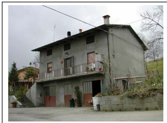
UNITA' EDILIZIA NR. 2