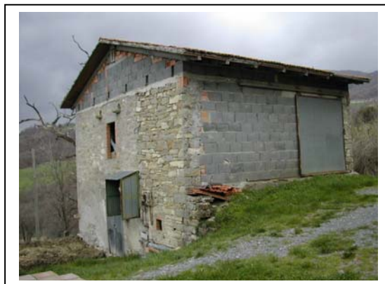
UNITA' EDILIZIA NR. 13