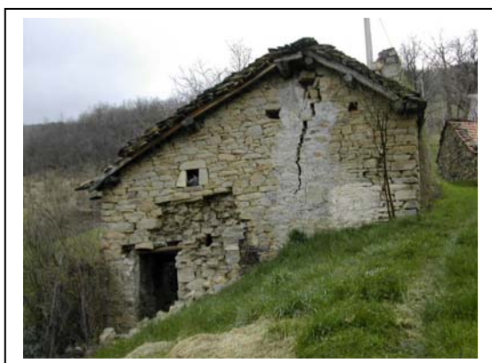
UNITA' EDILIZIA NR. 14