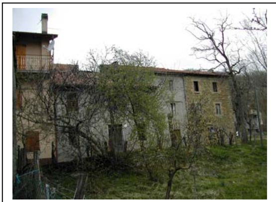
UNITA' EDILIZIA NR. 8-9