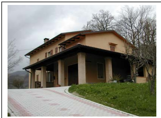
UNITA' EDILIZIA NR. 1