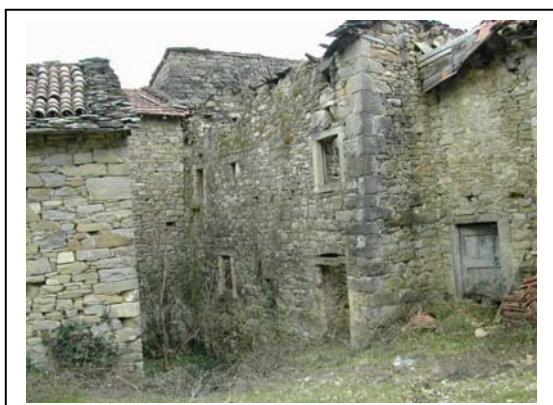
UNITA' EDILIZIA NR. 9