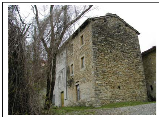
UNITA' EDILIZIA NR. 9