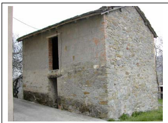
UNITA' EDILIZIA NR. 11