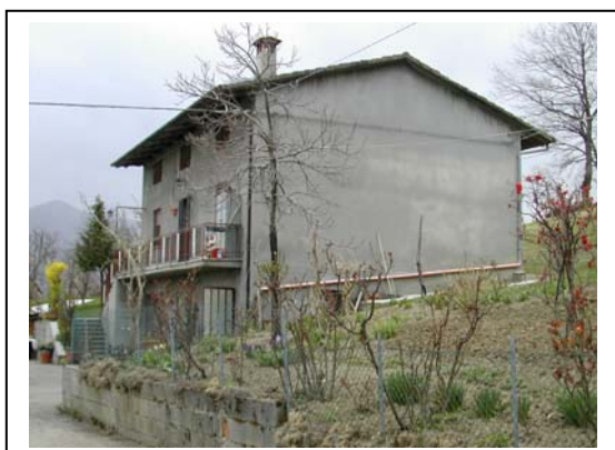
UNITA' EDILIZIA NR. 2