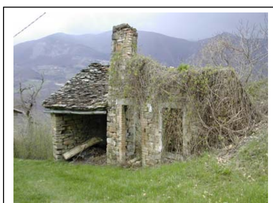
UNITA' EDILIZIA NR. 14