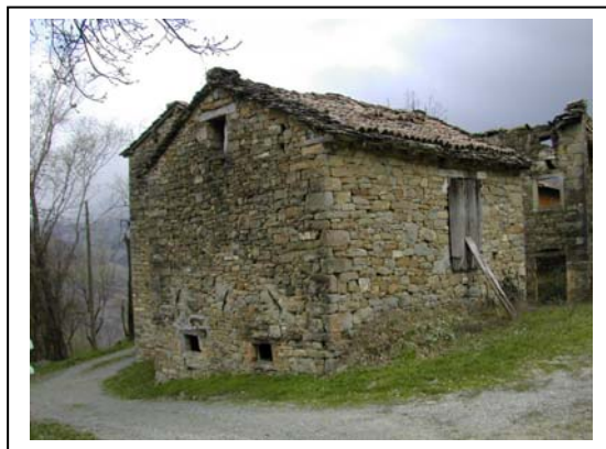
UNITA' EDILIZIA NR. 6