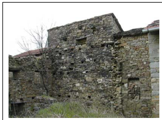
UNITA' EDILIZIA NR. 9