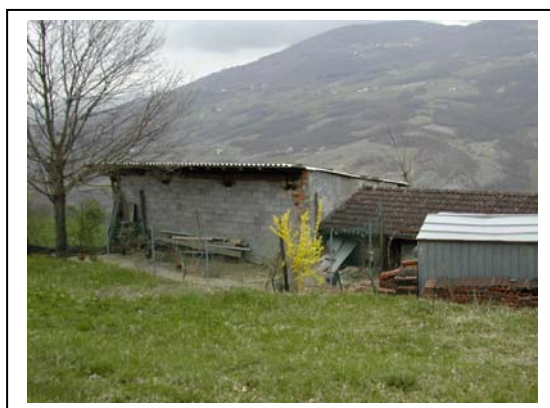
UNITA' EDILIZIA NR. 4