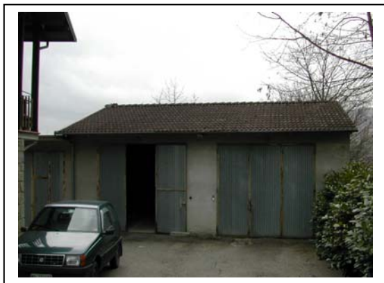
UNITA' EDILIZIA NR. 5