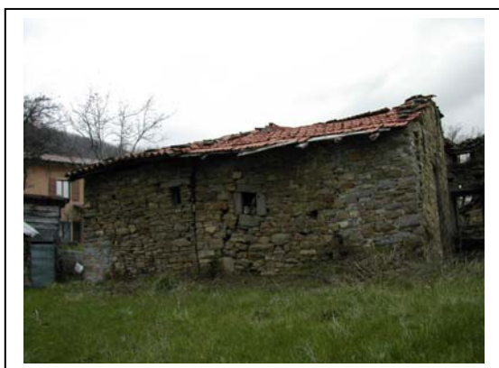
UNITA' EDILIZIA NR. 10