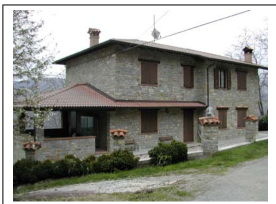
UNITA' EDILIZIA NR. 3