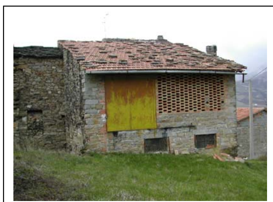
UNITA' EDILIZIA NR. 7