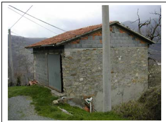
UNITA' EDILIZIA NR. 13