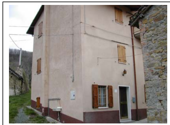
UNITA' EDILIZIA NR. 8