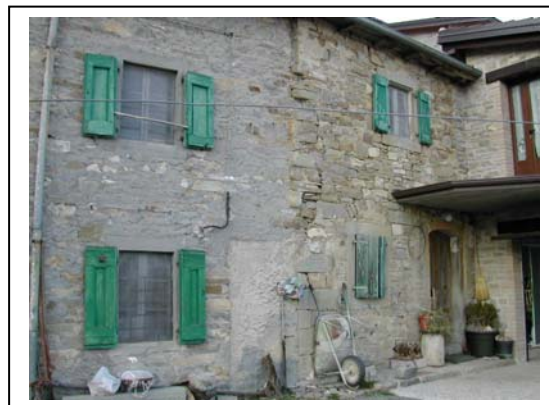
UNITA' EDILIZIA NR. 3