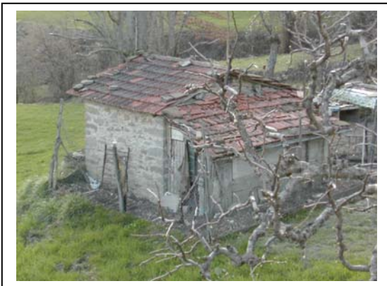
UNITA' EDILIZIA NR. 15