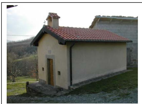
UNITA' EDILIZIA NR. 8