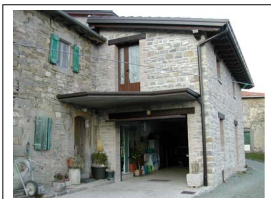
UNITA' EDILIZIA NR. 3