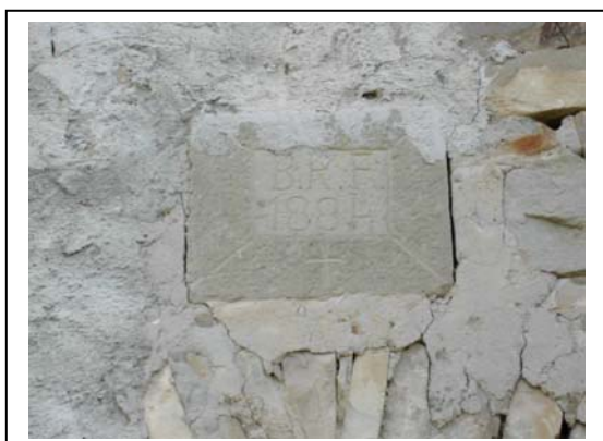
UNITA' EDILIZIA NR. 6