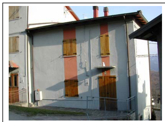
UNITA' EDILIZIA NR. 3