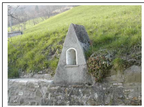
UNITA' EDILIZIA NR. 5