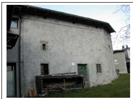
UNITA' EDILIZIA NR. 7