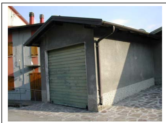
UNITA' EDILIZIA NR. 4