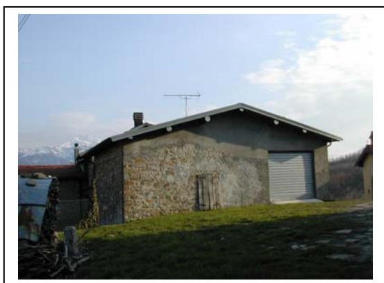
UNITA' EDILIZIA NR. 9