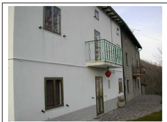
UNITA' EDILIZIA NR. 10