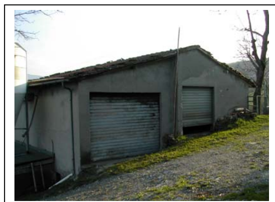
UNITA' EDILIZIA NR. 11