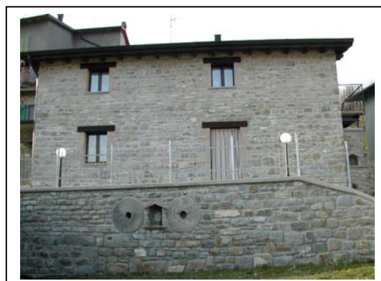
UNITA' EDILIZIA NR. 3