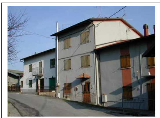
UNITA' EDILIZIA NR. 3