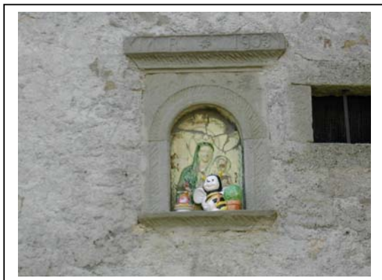
UNITA' EDILIZIA NR. 7