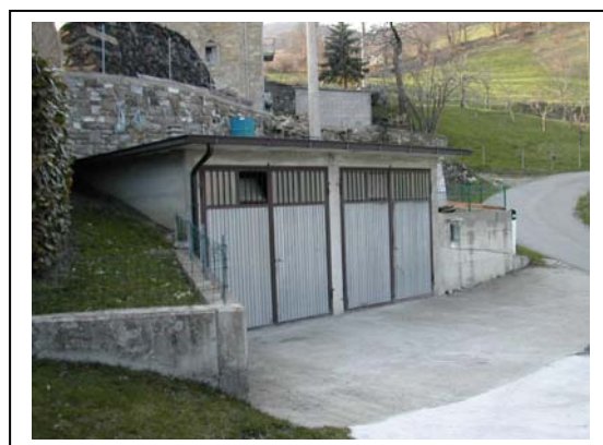
UNITA' EDILIZIA NR. 12