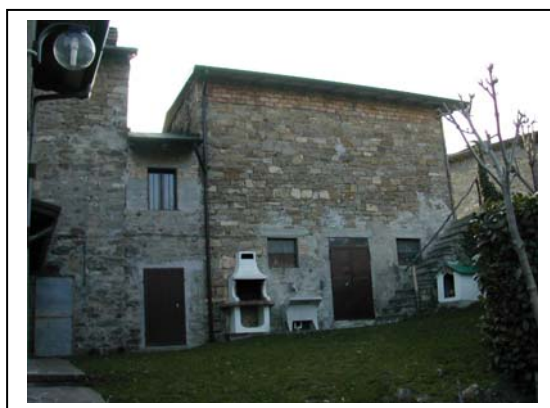
UNITA' EDILIZIA NR. 9