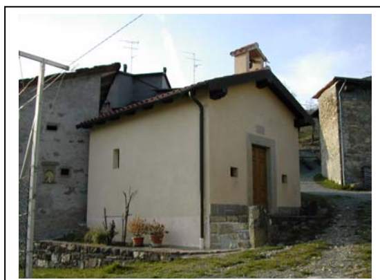
UNITA' EDILIZIA NR. 8