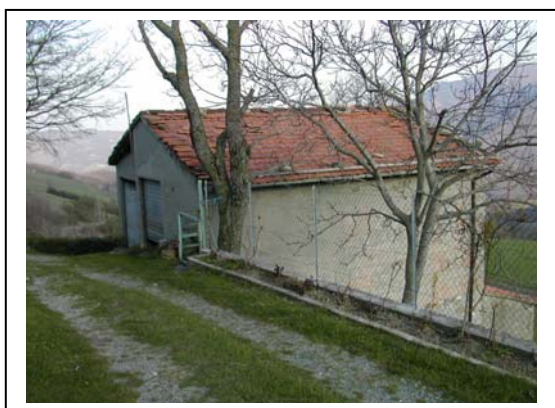
UNITA' EDILIZIA NR. 11