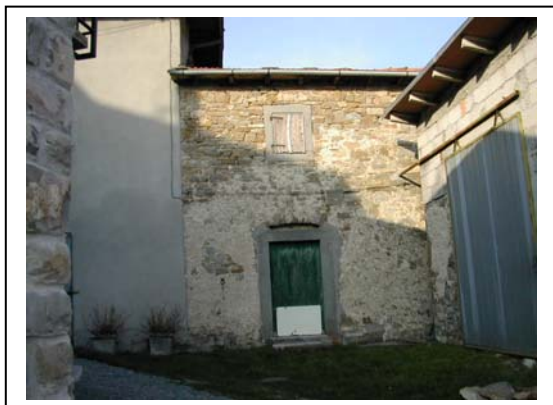
UNITA' EDILIZIA NR. 1-6