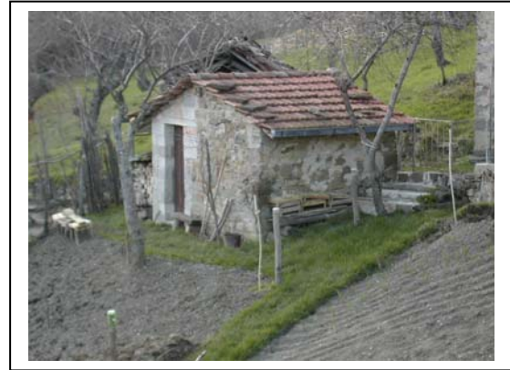
UNITA' EDILIZIA NR. 14