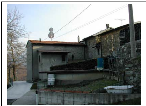
UNITA' EDILIZIA NR. 10-9