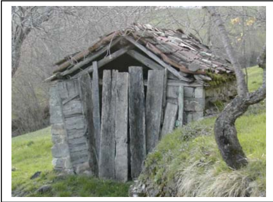
UNITA' EDILIZIA NR. 13