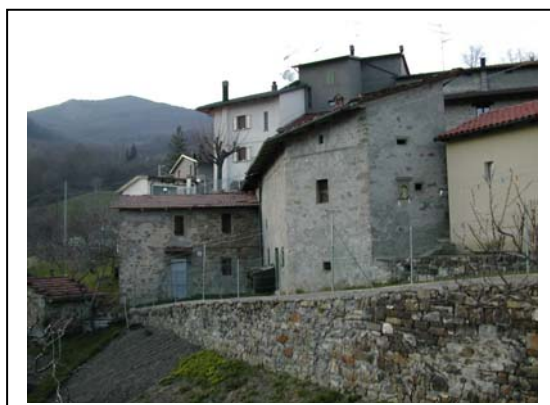
UNITA' EDILIZIA NR. 7