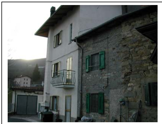
UNITA' EDILIZIA NR.3