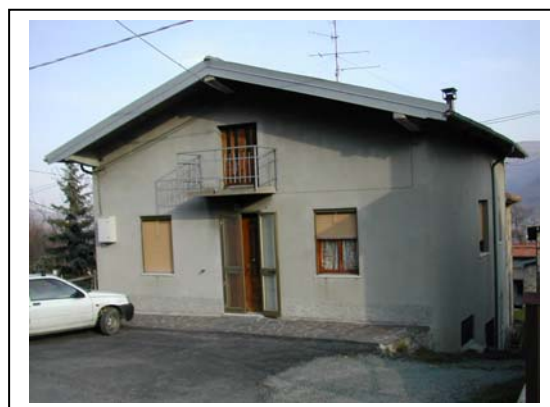
UNITA' EDILIZIA NR. 2