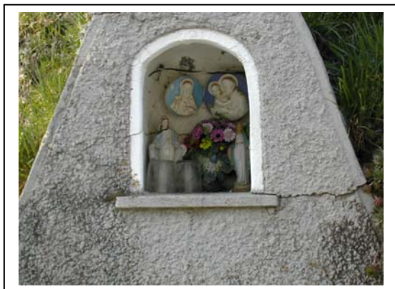
UNITA' EDILIZIA NR. 5