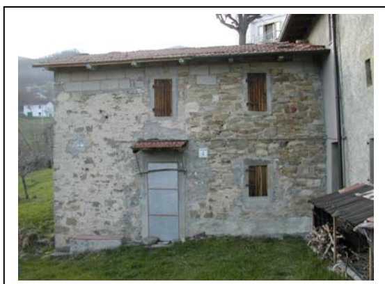
UNITA' EDILIZIA NR. 7