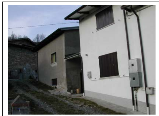
UNITA' EDILIZIA NR. 9-10