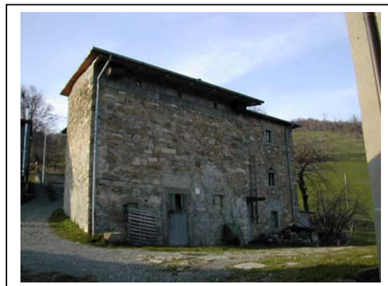
UNITA' EDILIZIA NR. 6-1