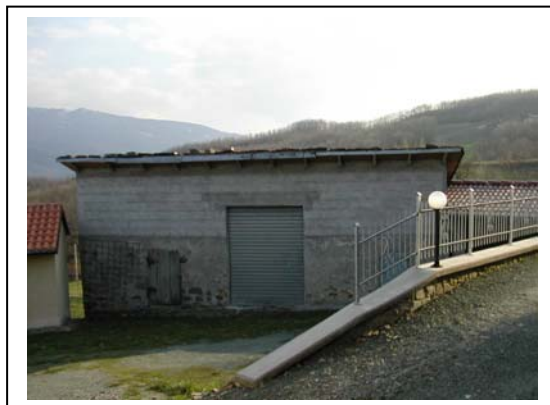
UNITA' EDILIZIA NR. 7