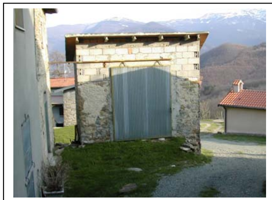
UNITA' EDILIZIA NR. 6