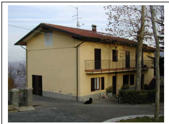
UNITA' EDILIZIA NR. 4