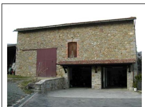
UNITA' EDILIZIA NR. 3