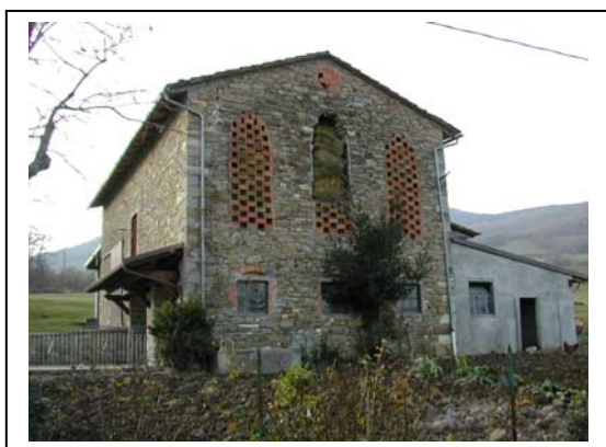
UNITA' EDILIZIA NR. 3