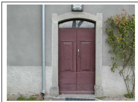
UNITA' EDILIZIA NR. 1