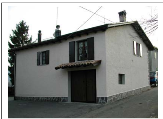
UNITA' EDILIZIA NR. 2