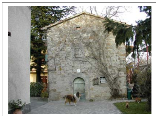
UNITA' EDILIZIA NR. 5