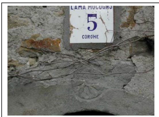
UNITA' EDILIZIA NR. 5