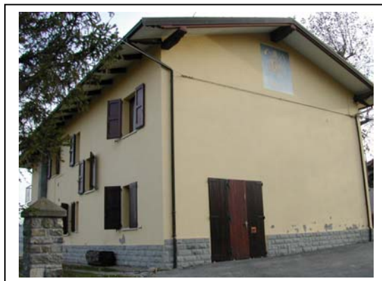
UNITA' EDILIZIA NR. 4