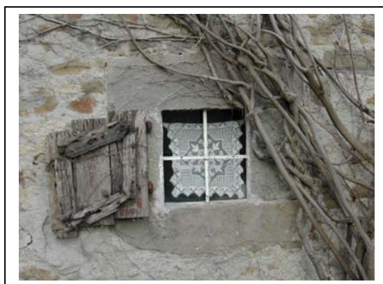
UNITA' EDILIZIA NR. 5