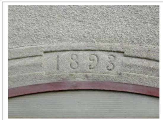
UNITA' EDILIZIA NR. 1