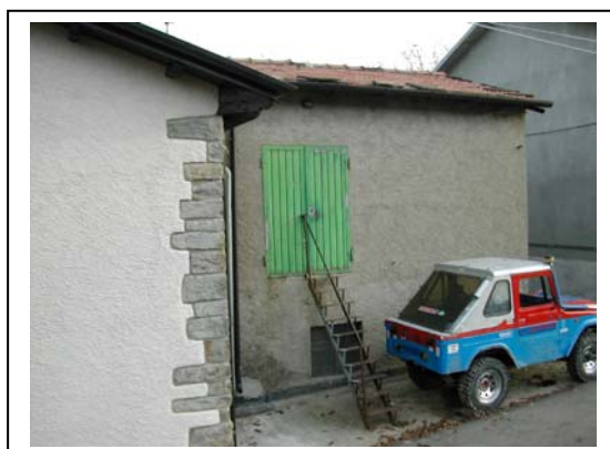
UNITA' EDILIZIA NR. 2