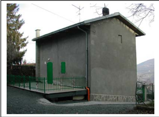
UNITA' EDILIZIA NR. 6