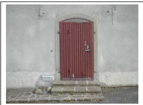
UNITA' EDILIZIA NR. 1