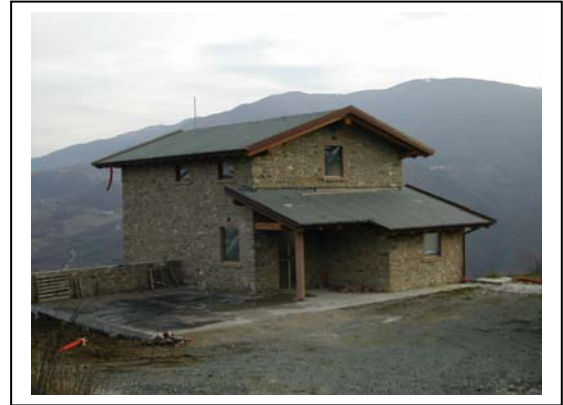
UNITA' EDILIZIA NR. 7