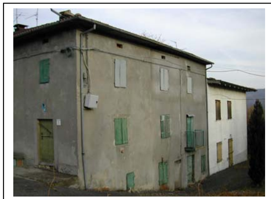
UNITA' EDILIZIA NR. 1