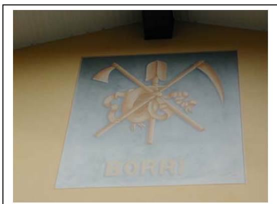
UNITA' EDILIZIA NR. 4