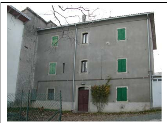
UNITA' EDILIZIA NR. 1