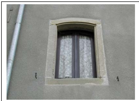
UNITA' EDILIZIA NR. 1