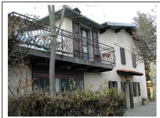
UNITA' EDILIZIA NR. 2