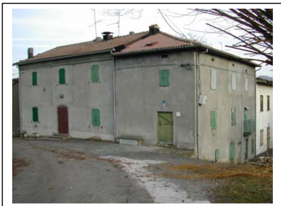
UNITA' EDILIZIA NR. 1