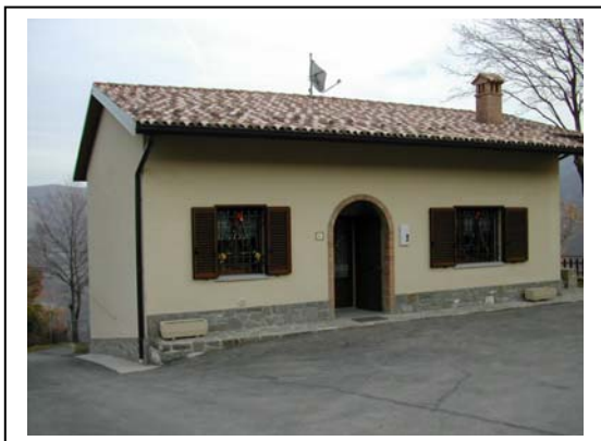
UNITA' EDILIZIA NR. 5