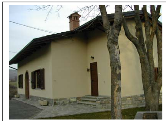
UNITA' EDILIZIA NR. 5