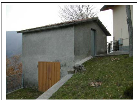
UNITA' EDILIZIA NR. 6