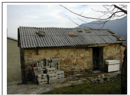
UNITA' EDILIZIA NR. 7