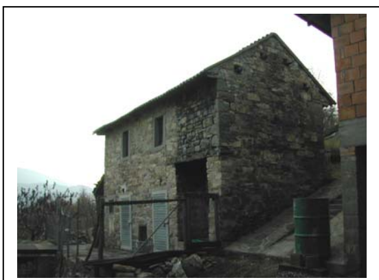
UNITA' EDILIZIA NR. 7