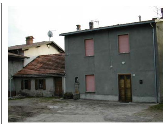
UNITA' EDILIZIA NR. 4-3