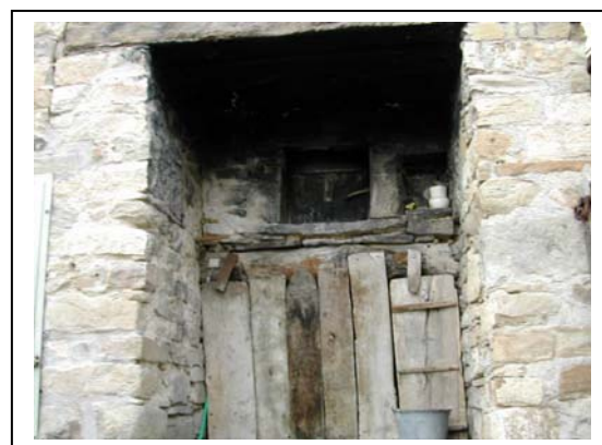
UNITA' EDILIZIA NR. 7