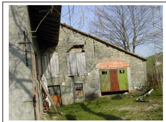
UNITA' EDILIZIA NR. 10