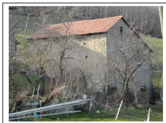
UNITA' EDILIZIA NR. 7