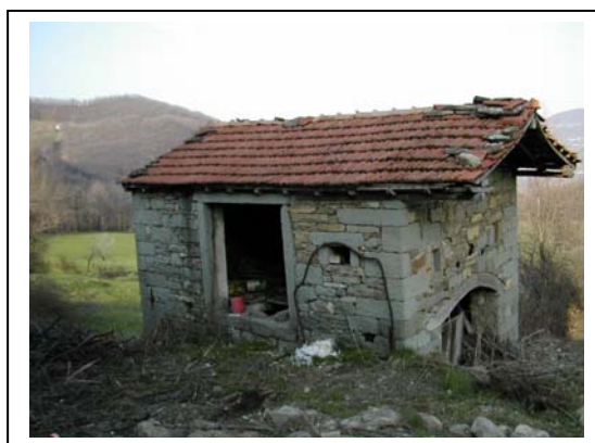
UNITA' EDILIZIA NR. 9