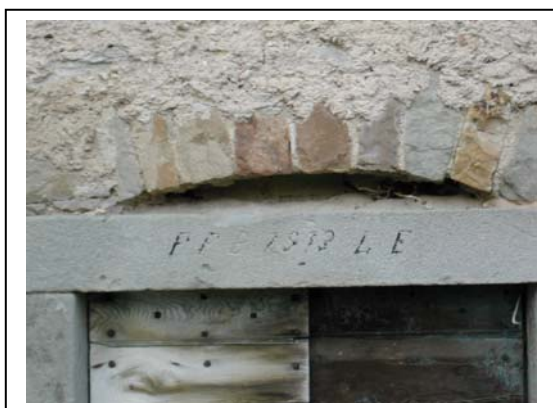
UNITA' EDILIZIA NR. 7