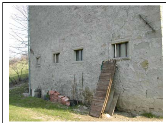
UNITA' EDILIZIA NR. 10