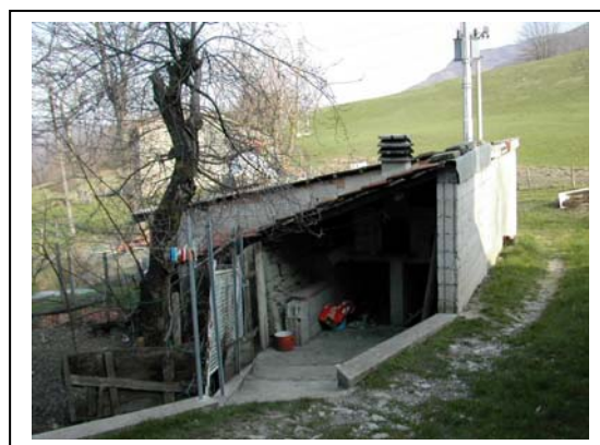
UNITA' EDILIZIA NR. 11