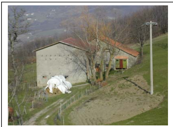
UNITA' EDILIZIA NR. 10