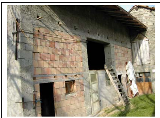
UNITA' EDILIZIA NR. 10