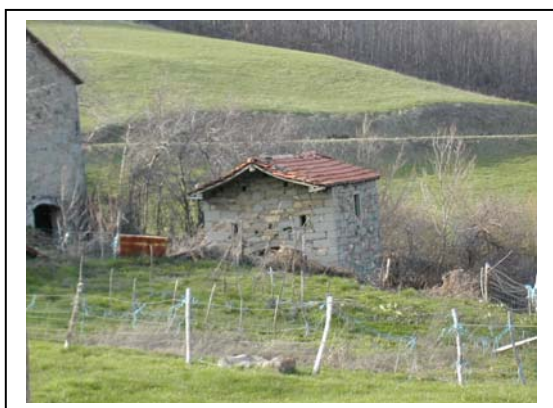
UNITA' EDILIZIA NR. 9