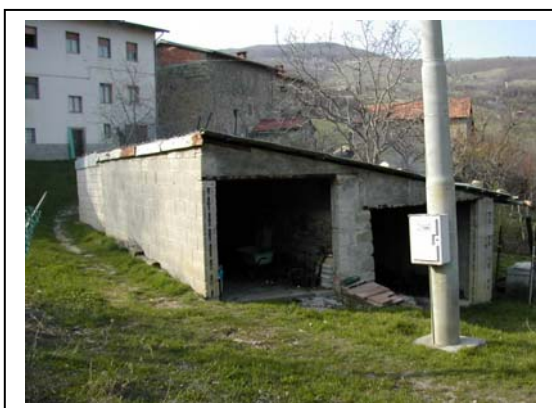
UNITA' EDILIZIA NR. 11