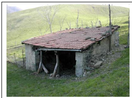
UNITA' EDILIZIA NR. 8