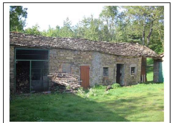
UNITA' EDILIZIA NR. 10