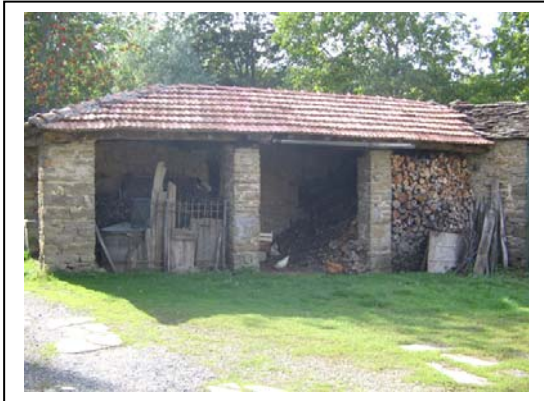
UNITA' EDILIZIA NR. 11