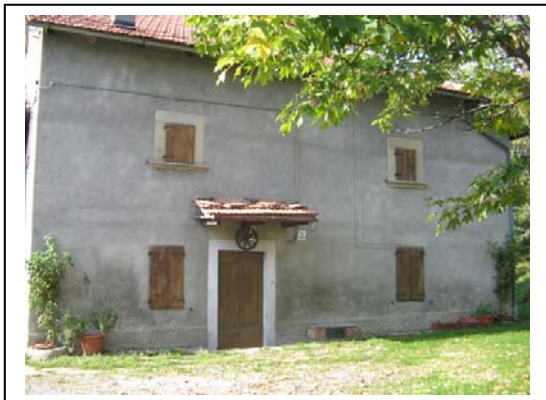
UNITA' EDILIZIA NR. 8