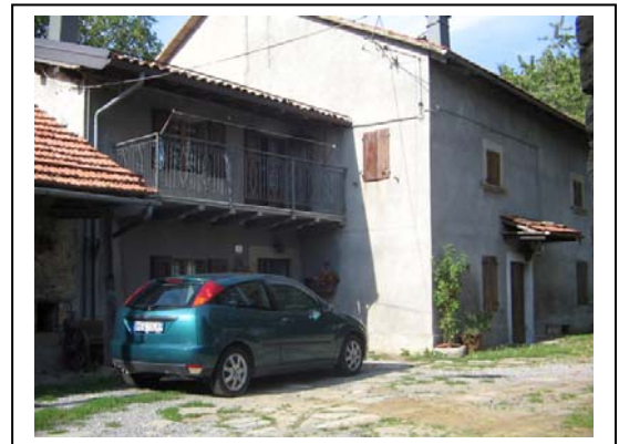
UNITA' EDILIZIA NR. 8