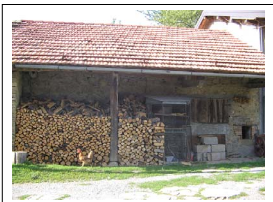
UNITA' EDILIZIA NR. 9