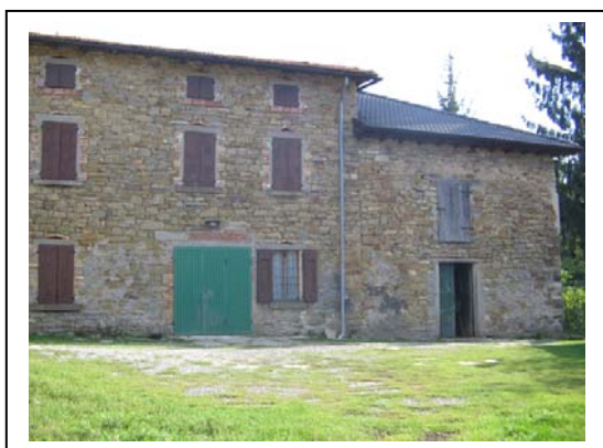
UNITA' EDILIZIA NR. 2-3