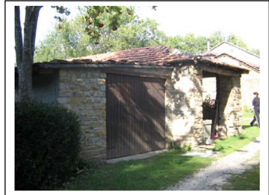
UNITA' EDILIZIA NR. 12