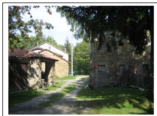
UNITA' EDILIZIA NR. 2-9-11-12