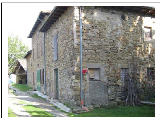
UNITA' EDILIZIA NR. 2-3-4-6