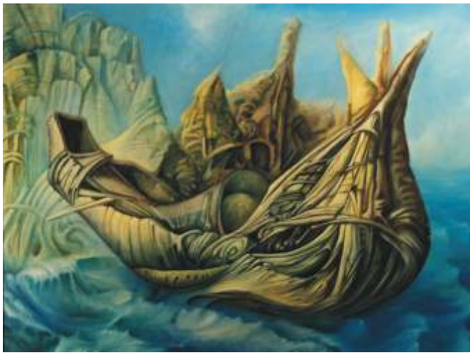
11° giorno di navigazione - 1986 Olio su tela , cm 80 x 60

“Lo studio?... il vantaggio di poter conversare con me stesso” (Antistene)