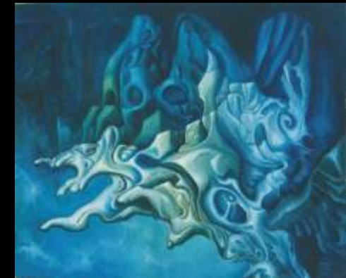
Esplosione (1985) olio su tela, 40 x 50

Massimo Mazzieri Antologica di pittura - opere 1985 - 2009