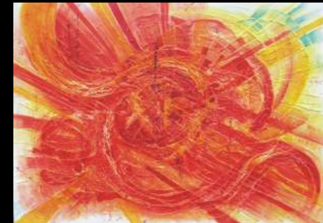
Inseguendo la passione (2008) Tecnica mista su tavola, 126 x 90