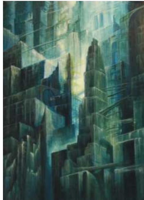
Incubo pomeridiano 1999 Olio su tela cm 50 x 70

proprio, tutto nuovo) quell'Alter Ego invisibile, immateriale e irrazionale che a volte domina ciascuno di noi. Ma il dilemma, che apparentemente sembrerebbe così giunto ad una rapida soluzione - almeno per la