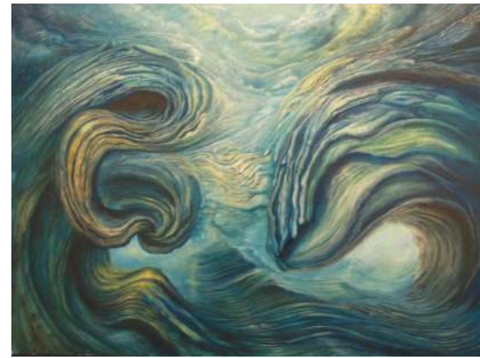
Contrapposizione - 2003 Olio su tela, 50x60

parte artistica -, nuovamente si ripropone ora sotto un'altra veste: se la pittura aniconica dell'epoca contemporanea è un'arte senza soggetto, poiché il soggetto di tale arte è la pittura stessa ed è lo strumento con cui il pittore del Novecento osa spingersi oltre la soglia del visibile, cosa sono per il Mazzieri il movimento gestuale, i criptici segni, l'abbondante materia, le linee e le cromie delle sue efficaci rappresentazioni?