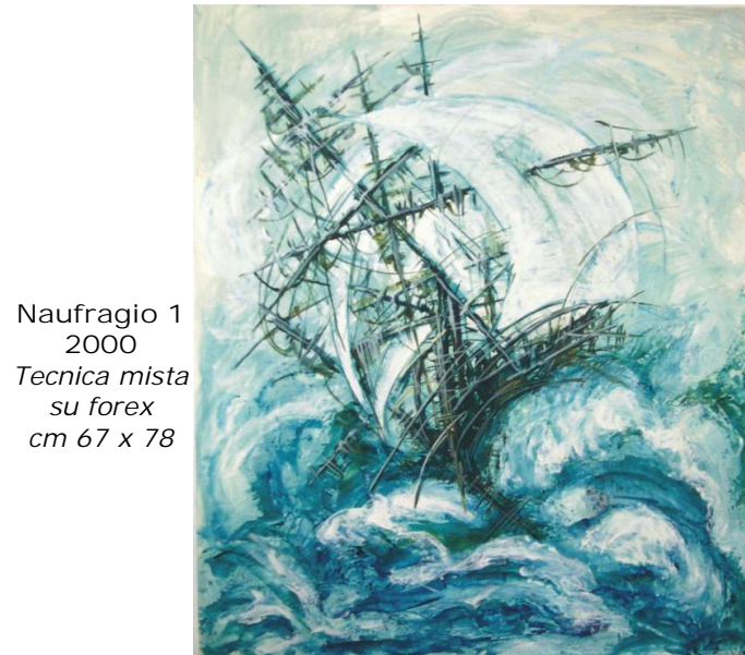
Naufragio 1 2000 Tecnica mista su forex cm 67 x 78